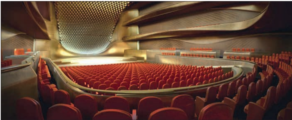
مسرح تفوق الوصف

المبنى يشتمل على مسرح كبير يتسع لـ 1776 كرسيًا ومسرح وسط يتسع لـ 632 كرسيًا ومسرح صغير يتسع لـ 188 كرسيًا