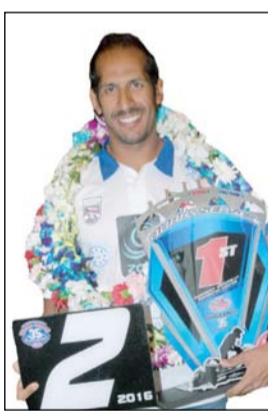
البطل العالمي نواف محمد الفرحان

قبل النادي البحري الرياضي الكويتي، تحت مظلة الهيئة العامة للرياضة، استطاع أن يحصل على مجموع 11 ميدالية (4 ذهبية - 3 فضية - 4 برونزية)، وكان آخرها حصوله على ذهبية فئة الإيمجر ليمتد نورمالي اسبريتد للهواة خلال بطولة العالم الأخيرة التي أقيمت مطلع أكتوبر الجاري وأكد أن التحدي الذي واجه المنتخب هذا العام خلال مشاركته الأخيرة من أجل المحافظة على اللقب كان