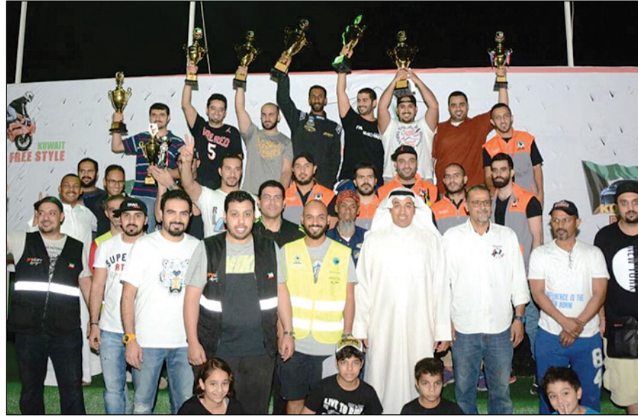
رئيس نادي السيارات والدراجات الآلية الشيخ أحمد الداود مع الفائزين بالبطولة

كبرى على تنظيم مختلف الفعاليات بصورة محترفة تعتبر مفخرة لرياضة السيارات». ونوه بالمستوى الفني المتطور واللافت