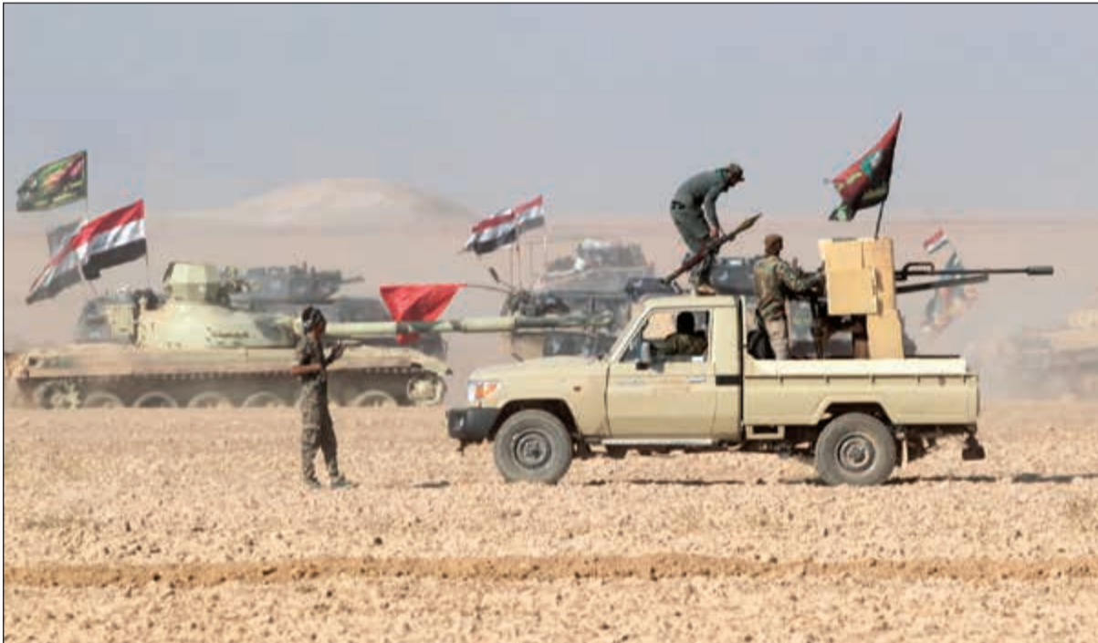
القوات العراقية و«الحشد الشعبي» على مشارف قرية عين ناصر جنوب الموصل (ا.ف.ب)

للقوات العراقية و«الحشد الشعبي» على مشارف قرية عين ناصر جنوب الموصل (ا.ف.ب)