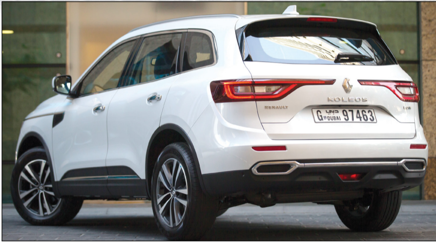
رينو كولويس صممت خصوصاً لتتلاءم مع متطلبات الشرق الأوسط

ويتيميز النظام بالسهولة الشديدة في الاستخدام، حيث يتم تفعيله من خلال الضغط على زر على يسار عجلة القيادة ليتمكن السائق من الختيار وضع من الأوضاع الثلاثة: 2WD أو 4WD AUTO أو 4WD LOCK وتعمل المصابيح الأمامية Pure Vision بالكامل بتقنية الهالوجين أثناء الرؤية الليلية، LED، مما يجعلها أكثر قوة بنسبة 20٪ مقارنة بمصابيح الهالوجين أثناء الرؤية الليلية، وتوفر المصابيح التي تعمل في وضوح النهار للسيارة قدرة إضاءة فريدة من نوعها، كما تتميز المصابيح الخلفية التي