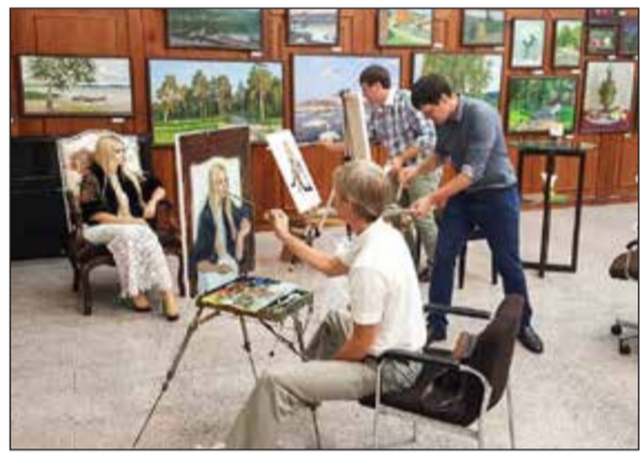
أحد الفنانين يرسم بورتريه لابنة السفير سلوماتين