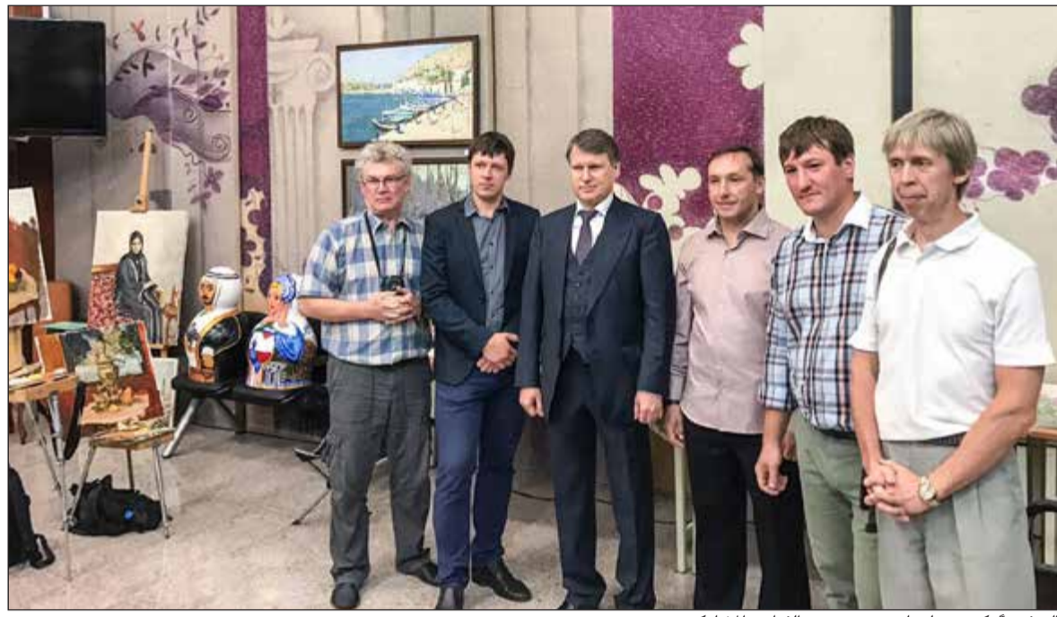
السفير الروسي سلوماتين مع عدد من الفنانين المشاركين