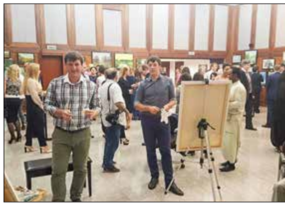
الفنانون قدموا شرحا عن لوحاتهم لرواد المعرض