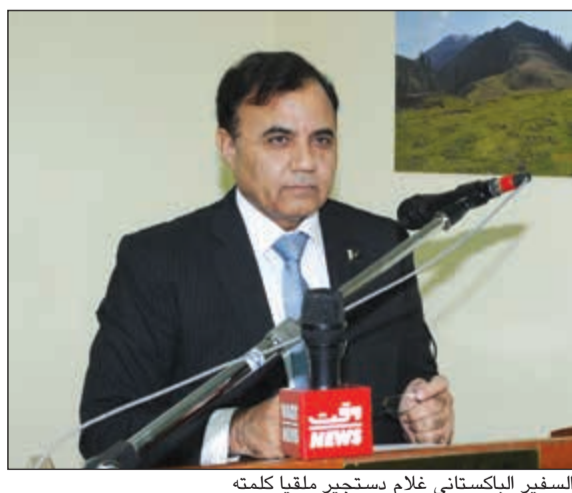
السفير الباكستاني غلام دستجير ملقيا كلمته

أقره المجتمع الدولي. ودعا دستجير المجتمع الدولي إلى الانتباه جيدا للتجاوزات في حق الإنسانية وانتهكات حقوق الإنسان التي تحدث في جامو وكشمير، مطالبا المجتمع الدولي بأن يسطع بمسؤولياته وأن يفي بوعوده لأهل كشمير وأن يكتفهم من حقه في تقرير مصيرهم، مشيرا إلى مساندة باكستان لكشمير في حقها المشروع.