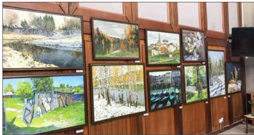
جانب من لوحات المعرض

إرهابيون وإنما مديون فقط، حيث أوقعت هذه الضربة عددا من الضحايا وقمنا نحن بالإشارة لهم بشأن هذا الحادث وكان رد الأميركيين أن سقوط الضحايا في الحروب أمر طبيعي. وأكد سلوماتين احترام بلاده للهدنة في حلب من خلال وقف الطلعات الجوية، إلا أن الإرهابيين أنفسهم لم يحترموا، مجددا استعداد بلاده ودعمها للحل السلمي في سورية الذي يقره السوريون أنفسهم والذي ينبثق من المبادئ الأساسية التي تميز بين المعارضة والإرهاب، خاصة أن مكافحة الإرهاب مهمة بالنسبة للجميع، ومن المهم احترام سيادة وحدة سورية.