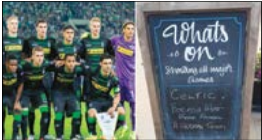
اللائحة التي اثارت مواقع التواصل الاجتماعي

حل بوروسيا مونشنغلاباخ الألماني ضيفاً على سلتيك الإسكتلندي الاسبوع الماضي في دوري ابطال أوروبا لكرة القدم، لكن ما كتبه حائة اسكتلندية أمام مدخلها تحول ليصبح قصة طريقة جالت العالم.