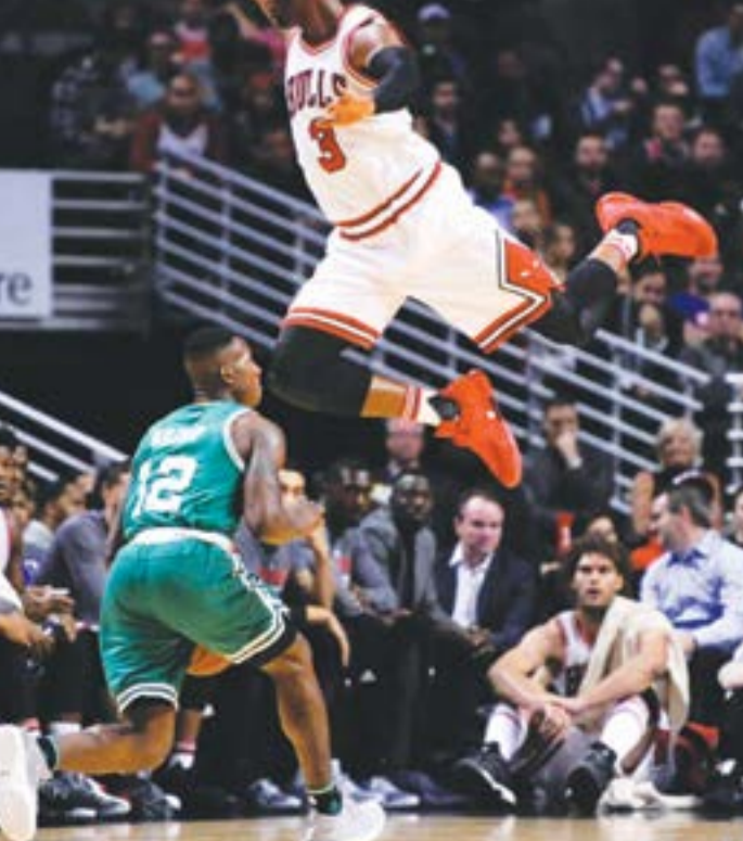
نجم شيكاغو بولز دواين وايد يحاول منع لاعب بوسطن نيري روزر من التسديد (أضرب)

وسجل وايد في المباراة الاولى لفريقه الجديد 22 نقطة مع 6