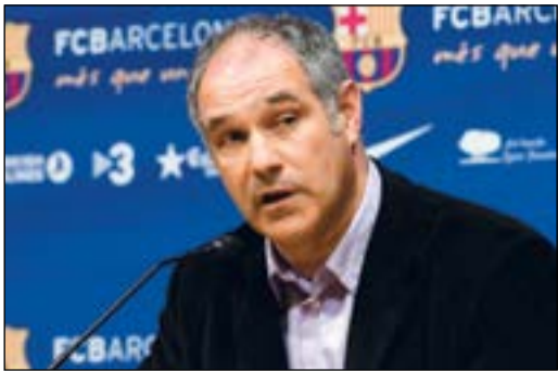
اندوني زوبيراريتا مكسب كبير للنادي الفرنسي

أعلن رئيس نادي مرسيليا الفرنسي جاك-هنري ايروود ان الحارس الدولي الإسباني السابق اندوني زوبيراريتا سيتولى منصب المدير الرياضي للنادي المنوسطي، وهو نفس منصبه السابق مع برشلونة الإسباني.