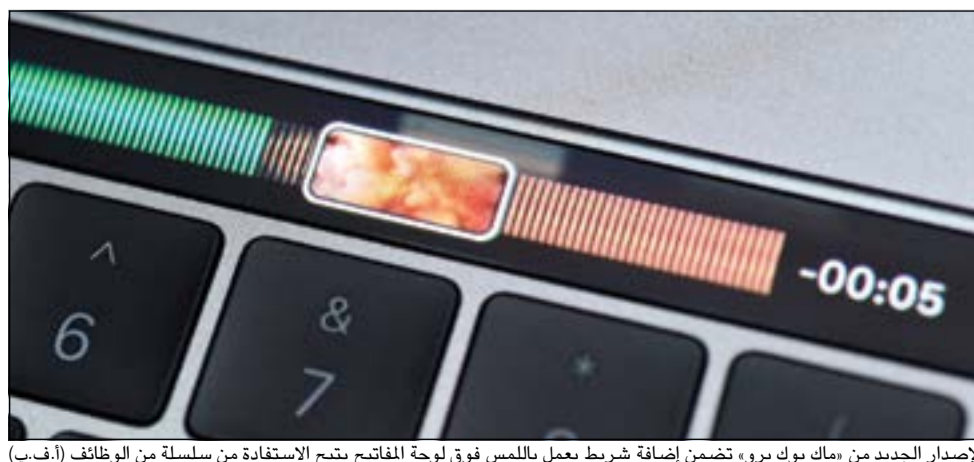
الإصدار الجديد من «ماك بوك برو» تضمن إضافة شريط يعمل باللمس فوق لوحة المفاتيح يتيح الاستفادة من سلسلة من الوظائف

سان فرانسيسكو - أ.ف.ب: كشفت مجموعة «آبل» المعلوماتية عن نسخة محدثة من حواسيب «ماك بوك برو» المحمولة في جملة التحديثات بإضافة شريط يعمل باللمس فوق لوحة المفاتيح يتيح الاستفادة من سلسلة من الوظائف، حيث تحل هذه اللوحة الجديدة المعروفة بـ «تاتش بار» محل سلسلة المفاتيح المعروفة في النظام التقليدي بـ «إف-أف» حتى أف12». وأوضح «آبل» أن لوحة «تاتش بار» لا تتماشى فحسب مع حواسيبها الخاصة، بل يمكن أيضا تكييفها مع تطبيقات من تصميم شركات أخرى، كما أضافت عملاقة التكنولوجيا الأميركية على حواسيب «ماك بوك برو» خدمة التعرف على البصمات الرقمية «تاتش أي دي» المعتمدة في هواتف «أي فون».