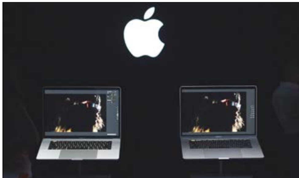
كمبيوتر «ماك بوك برو» الذي أطلقته آبل بتكنولوجية جديدة من نوعها (أ.ف.ب)