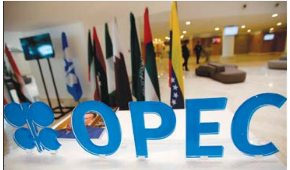
هل تصل «أوبك» إلى اتفاق لخفض الإنتاج أم ستتمنع الحسابات السياسية ذلك؟

وقال مندوب في أوبك قبل بدء الاجتماع «الأمر يزيدا تعقيدا.. في كل يوم تظهر مسألة جديدة».