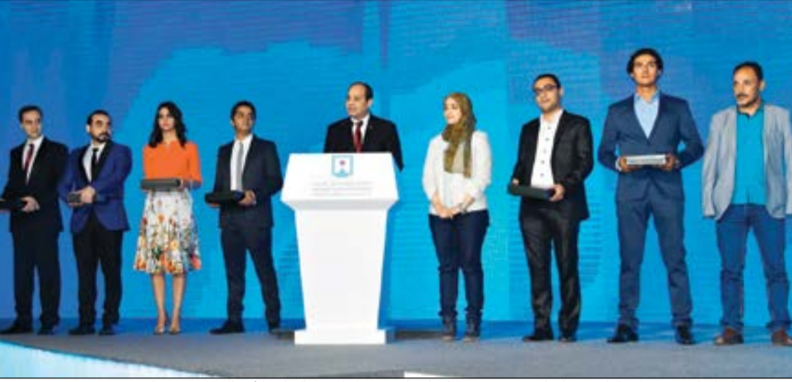
الرئيس عبدالفتاح السيسي خلال إلقاء توصيات المؤتمر وتوزيع جوائز الإبداع في ختام المؤتمر الوطني الأول للشباب بشرم الشيخ