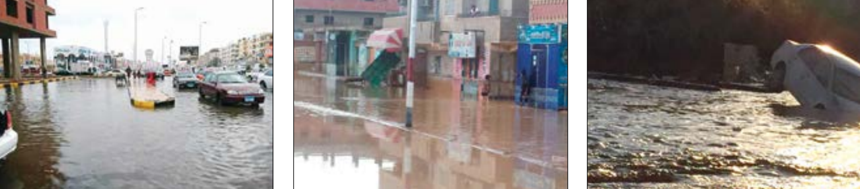
السيول تضرب مناطق مختلفة في مصر، مما تسبب في خسائر بشرية ومادية كبيرة.