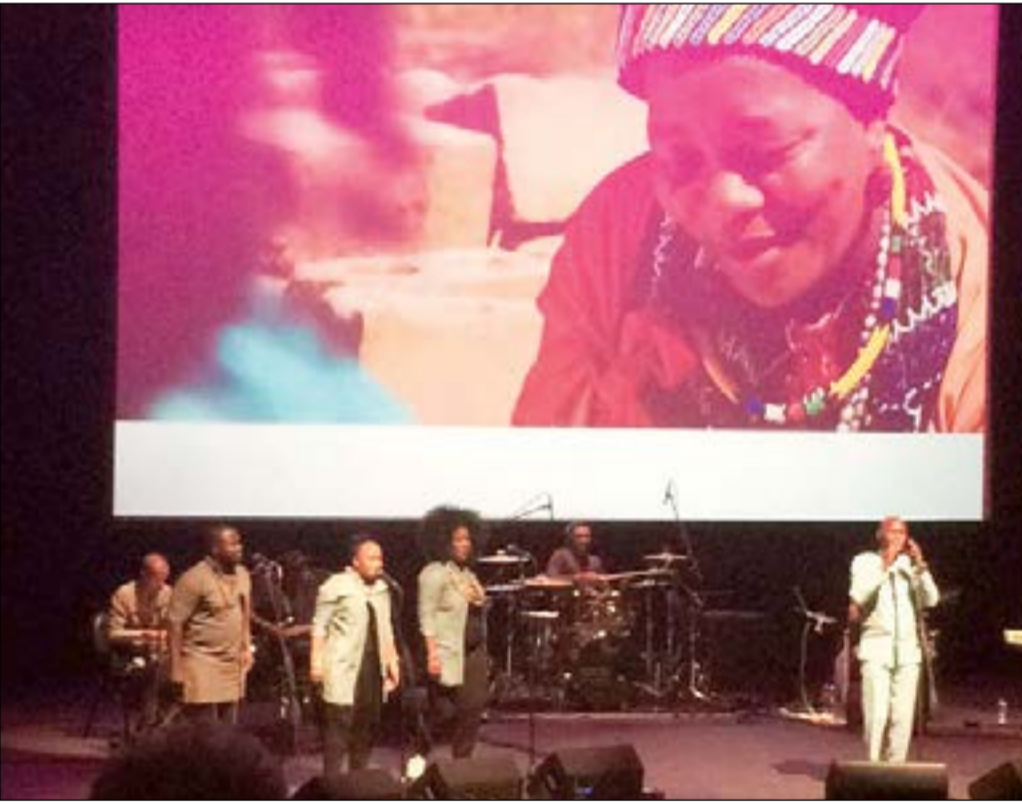
من حفل فرقة «جوي نينا»