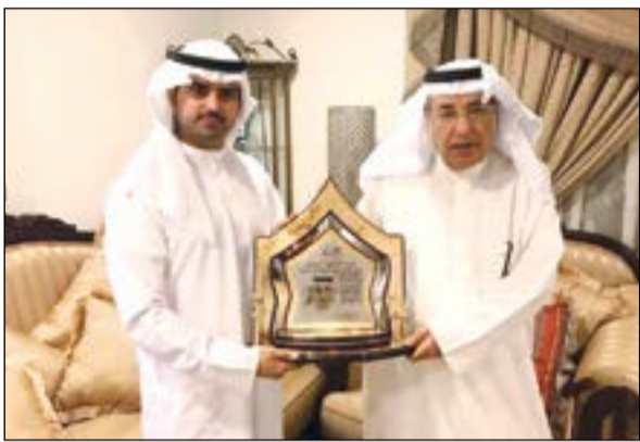
الشيخ مشعل المالك يقدم درعا تكريمية للشاعر عبد اللطيف البناي

قام الشيخ مشعل المالك بتكريم الشاعر الغنائي عبد اللطيف البناي باعتباره رائدا من رواد الشعر ممن قدموا أشعارا غنائية وطنية وعاطفية خالصة لاقت استحسان الملقى بالوطن العربي والكويت والخليج. في البداية، أشاد الشيخ مشعل المالك بما قدمه الشاعر عبد اللطيف البناي على مدى مسيرته الفنية باعتباره أحد الرموز الوطنية ممن كانت لهم بصمة واضحة في مسيرتهم الفنية وبما أضافه عبر قصائده على الفن الكويتي، لافتا إلى أن هذا التكريم يأتي في إطار الاهتمام المتزايد بنشر وإحياء الفنون الراقية، مشيرا إلى أن إبداعه قد تجاوز حدود الكويت إلى بقاع العالم راويا قصص وحكايات وكفاح الكويتيين بكلماته شعرا وإحساسا ونغما، ما يعد فخرا للجميع من جهته، أشاد الشاعر عبد اللطيف البناي بتلك المبادرة واللفتة الكريمة من