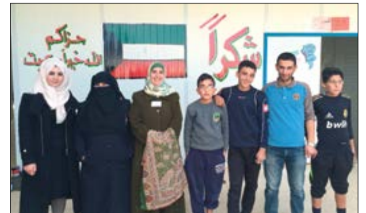
مجموعة من الطلبة والدرسات في مدرسة الشيخ صباح الاحمد