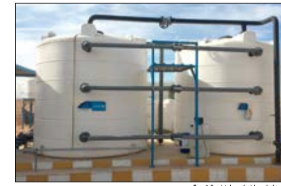
خزانات المياه داخل القرية