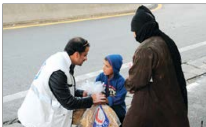
جانب من توزيع المساعدات