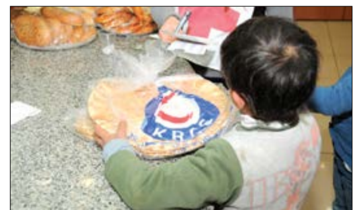
«الهلال الأحمر» تطلق مشروع «الرغيف» الـ 28

عن ان المؤسسات المانحة لا تغطي تكاليف مثل هذه العلاجات التي تتطلب فترة طويلة، مشيرا إلى ان الجمعية ساهمت مسبقا في علاج العديد من الحالات والأمراض المستعصية، فضلا عن تقديمها جهازا متطورا لفحص سرطان الثدي المبكر لمرکز صحي شرق لبنان لخدمة النازحين السوريين. وأكد ان هذه الخطوة تأتي ضمن خطط الجمعية لتنوع مساعداتها للنازحين السوريين، مشددا على أهمية ضرورة تضافر وتكامل الجهود لإغاثة النازحين السوريين في الداخل والخارج والمساهمة في تخفيف الحمل الكبير تكلفه العلاج، فضلا