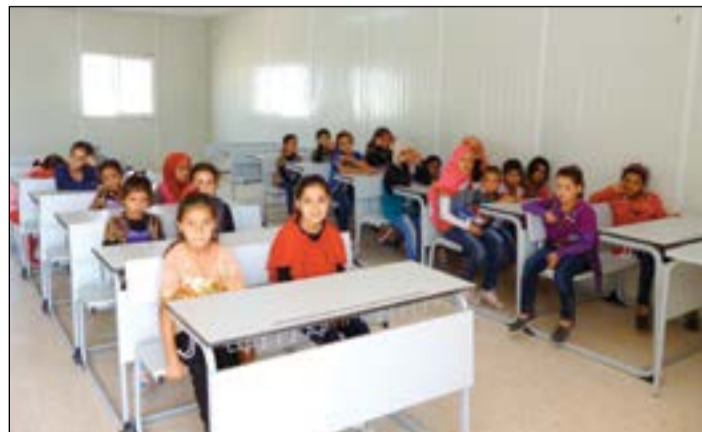
الطلبة في احد الفصول الدراسية