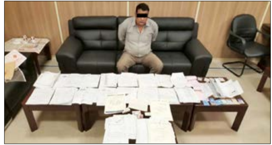
مدعي الصحافة وأمامه كم هائل من المعاملات والتي أنجز بعضها وكان بصدد إنجاز البعض الآخر

وإنما يقوم بإنجازها بمقابل مادي. وأشارت إلى أنه بعد البحث بهاتفه النقال تم العثور على رسائل بينه وبين بعض المنوبين يتفاوض معهم على المبالغ المالية لإنجاز المعاملات. وقد تمت إحالة المتهم إلى جهة الاختصاص.