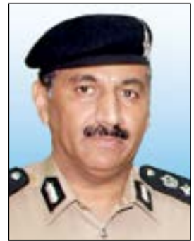
اللواء فهد الشويع

المركبة المخالفة بوضع مكان مراجعة المخالف لدفع الغرامة واستلام اللوحات المعدنية بعد انتهاء فترة سحبه. وأوضح اللواء الشويع أن القرار جاء نظرا لزيادة ظاهرة عرقلة حركة السير من قبل الكثير من المركبات وبالتالي سيتم تفعيل المادة 42 من قانون المرور والتي تنص على: (يجوز لمدير عام الإدارة العامة للمرور سحب رخصة السوق أو إجازة تسيير المركبة مع لוחاتها أو الاثنين معا سحبا إداريا