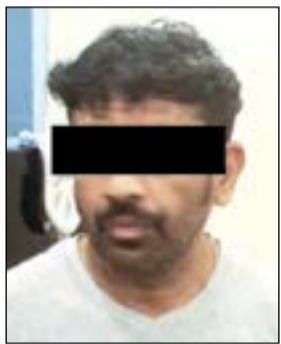
الوافد المصاب بالإيدز