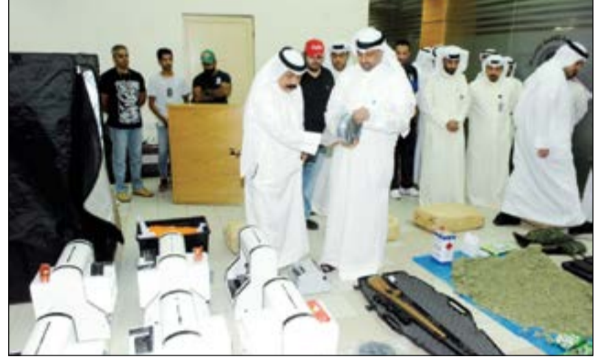
اللواء عبدالحميد العوضي يستمع إلى طريقة إخفاء «الكيميكال» ويعاين المضبوطات

أكبر تاجر الكيميكال وهو مواطن يبلغ من العمر 29 عاما، حيث ضبط بداخل شقته في السالمية التي اتخذها مخزنا ليخزن السموم ومصنعا للإعداد ما لا يقل عن 100 كيلو غراما من هذه المادة الخطرة. وبحسب مصدر أمني فإن معلومات وردت إلى مدير عام الإدارة العامة لمكافحة