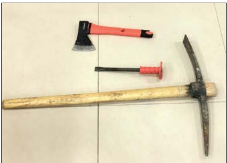
الأدوات المستخدمة في السرقات

السرية، حيث أسفر ذلك عن الوصول إلى هوية الجناة، بالتحقيق معهم، ومواجهتهم بما توصلت إليه التحريات أقروا بتكاثبهم عدة وقائع سرقات عن طريق الكسر والعبث في المحلات التجارية، وكانوا يستخدمون في عمليات السرقة آلة خاصة لكسر الأقفال، وأداة الفأس، مشيرة إلى أن الأحداث استغلوا عدم وجود بصمة لهم في النظام العام لوزارة الداخلية لحداثة الغروانية وقيدت جميعها ضد مجهول، وعليه تم تكثيف الدوريات الليلية والتنوعت بين سرقة مطاعم ومحلات.