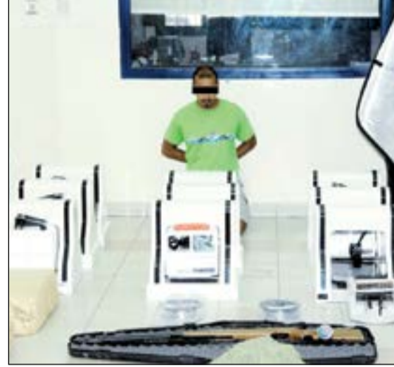
سلاح صيد وطبعا استخدمت في التهريب والأعداد أمام التهم

واصل قطاع الأمن العام ترجمة تعليمات نائب رئيس مجلس الوزراء ووزير الداخلية الشيخ محمد الخالد، ووكيل وزارة الداخلية الفريق سليمان الفهد بحملاته الأمنية بإشراف الوكيل المساعد بالإنابة اللواء إبراهيم الطراح. وبحسب مصدر أمني فإن رجال أمن العاصمة أوقفوا مواطنا مطلوبيا لحكم نهائي بالسجن 4 سنوات وآخر مطلوب للسجن 5 سنوات وسيدة مطلوبة للسجن 3 سنوات حكما نهائيا، ومواطنا