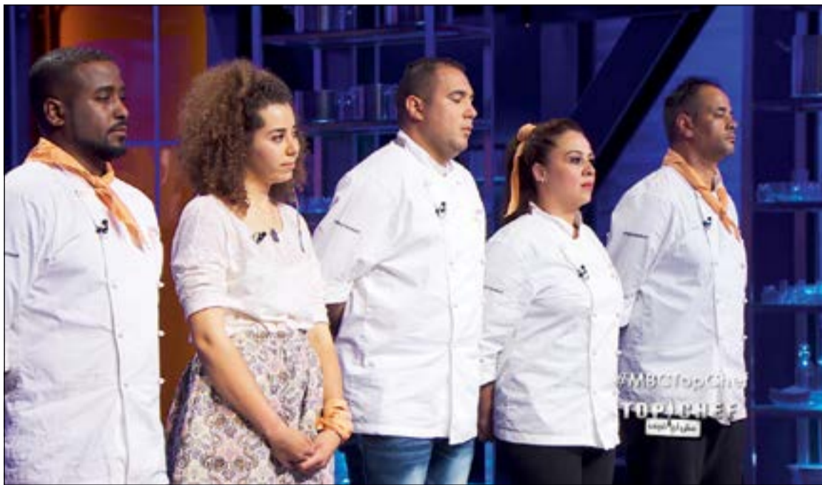
جانب من المشاركين في برنامج «Top Chef»

الحلوى الذي حضره بنفسه استحسن لجنة التحكيم والزبائن في آن معا، فكان هو الفائز بنتيجة الحلقة كصاحب أفضل طبق، فيما خرجت بعنى خضر من المنافسة، بعدما اعتبر طبقها الأضعف.