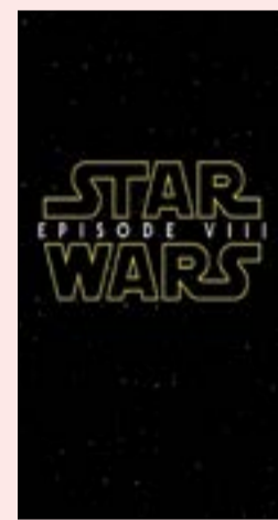
بوستر فيلم «حرب النجوم»

لا يخفى على أحد في العالم من عشاق السينما سلسلة أفلام «Star wars» بجميع أجزاءها. ويقال إن 1٪ فقط من سكان العالم لم يشاهدوا هذه السلسلة التي بدأت في ثمانينيات القرن الماضي واستمرت حتى يومنا هذا. وهي سلسلة أفلام الفضاء الوحيدة على الإطلاق التي حققت أعلى إيرادات في تاريخ السينما.