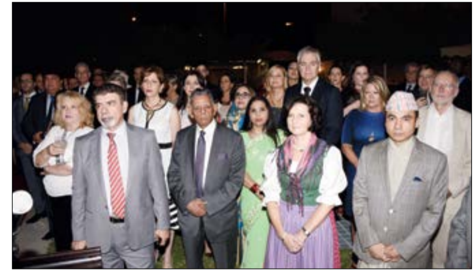
حضور دبلوماسي وشعبي في الاحتفال

ولفت إلى أن نائب رئيس مجلس الوزراء وزير الخارجية زار الأسبوع الماضي ألمانيا، حيث التقى وزير خارجية ألمانيا، وكانت الزيارة تهدف إلى بحث العلاقات الثنائية وكذلك الأوضاع الإقليمية والدولية، موضحاً أن الكويت تتطلع إلى زيارة وزير خارجية ألمانيا في الكويت نهاية العام الحالي. وأضاف أن الخالد التقى