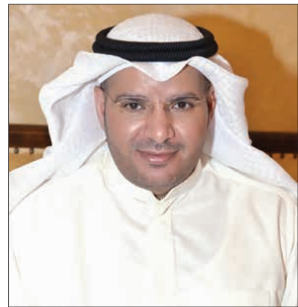
مرشح الدائرة الرابعة د. نايف ضبيان المطيري

اللحمة الوطنية ورعاية الشباب وتنوع مصادر الدخل ودعم المشاريع الصغيرة وغيرها.