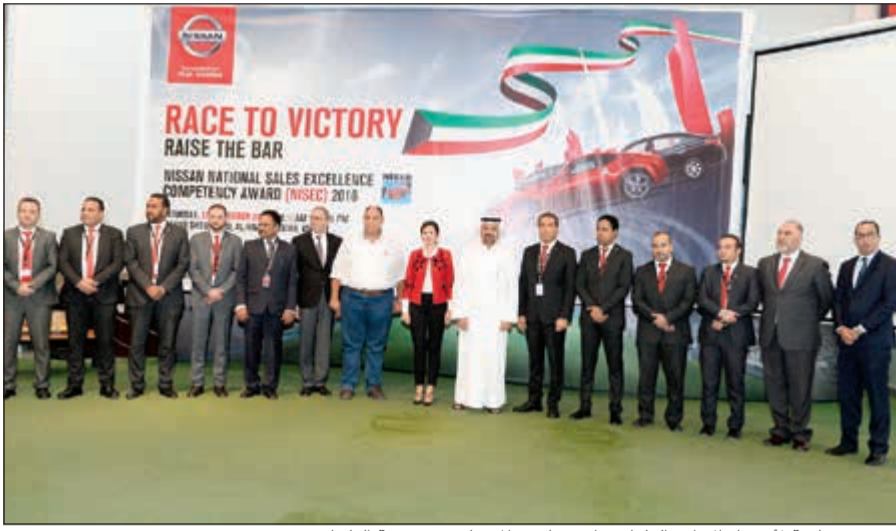
صورة جماعية لأعضاء الإدارة العليا مع استشاريي المبيعات بمجموعة البابطين