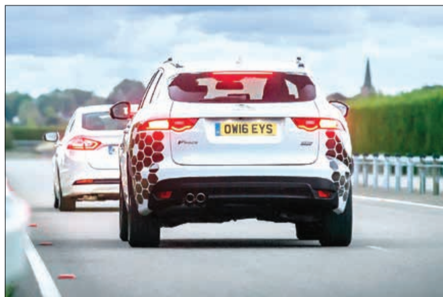
التقنيات الجديدة تسمح للسيارات بالتواصل مع بعضها بعضاً