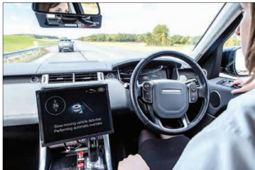
جاكوار لاند روفر تعمل على تطوير تقنيات السيارات الذاتية القيادة بالكامل

بشكل خاص عند القيادة في الضباب الكثيف أو عندما تكون حياتنا الواقعية، سواء على الطرقات الوعرة أو العادية وفي جميع الظروف الجوية. يسمح نظام المساعدة المتقدمة على الطريق السريع للفرملة بتجاوز السيارات الأخرى بشكل آلي، وكذلك البقاء ضمن حارة السير على الطريق السريع دون أن يحتاج السائق إلى لمس المقود أو الضغط على الدواسات. ويعمل نظام الإضاءة الأمامية للفرملة في حالات الطوارئ على تحذير السائق عندما تقوم سيارة موجودة في الأمام باستخدام الغراميل بشكل سريع ومفاجئ. وتعتبر هذه التقنية مفيدة