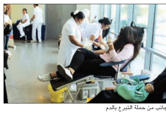
جانبا من حملة التبرع بالدم