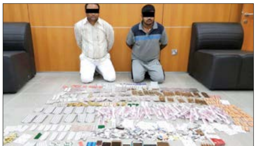
الممرض وشريكه العامل وأمامهما المنشطات وحبوب الإجهاض

وحسب مصدر امني فإن معلومات وردت إلى مباحث الفروانية بان ممرضاً في