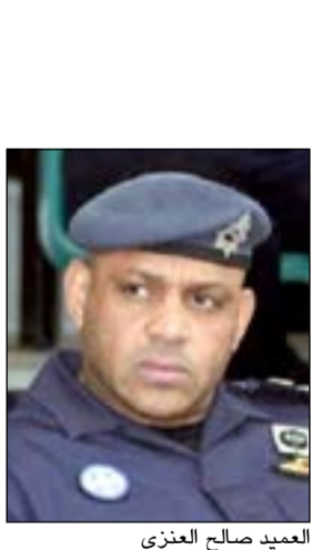
العميد صالح العنزي

المتنزهين، وعلى الفور وجه العميد مطر إحدى الدوريات ليمت توقيف الواصلين على مقربة من مسجد مجاور للحديقة، وتبين أن أغلبهم عاطل عن العمل. من جهة أخرى، أسفرت حملة لامن الفروانية عن ضبط 5 وافدين من الجنسية الهندية، وكانت الفرقة الأمنية قد وضعت نقطة أمنية، وأثناء وصول إحدى المركبات تبين أن كل من في داخلها في حالة سكر، وعند تفتيش المركبة عثر على 29 بطل خمر محلي كان بحوزة السكارى، فتمت إحالتهم إلى الجهات الأمنية.