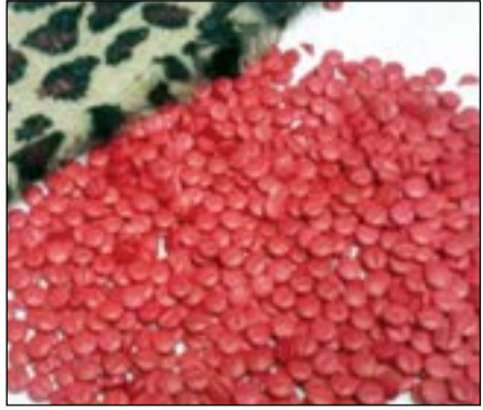
الترامادول المضبوط في المطار