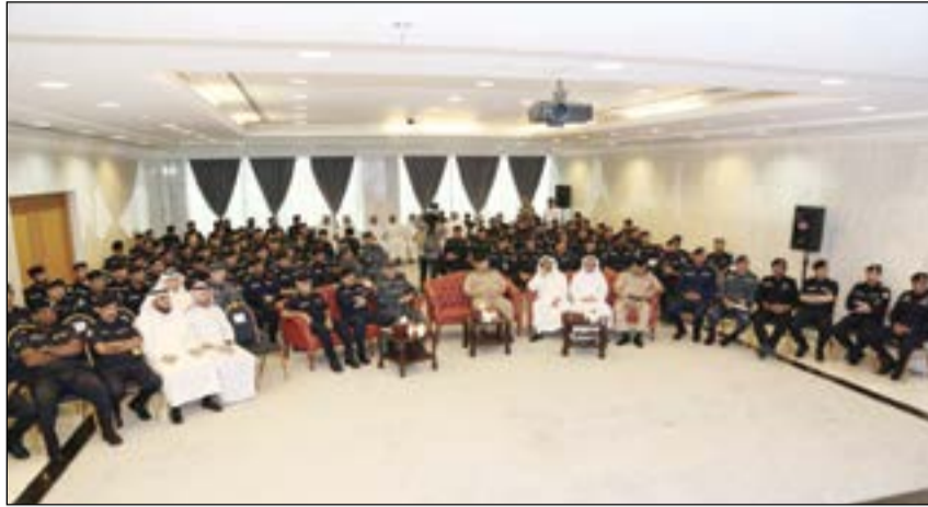
.. ومتوسطا قيادات الوزارة خلال عرض فيلم تصويري يوضح أخطاء في معالجة مواقف أمنية