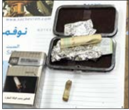
قطعة حشيش جلبها مواطن لدى قدومه برا

وعليه تمت إحالته والمضبوطات إلى الإدارة العامة لمكافحة المخدرات، كما تمكن رجال جمارك منفذ النويصيب من ضبط مواطن قادم للبلاد عبر المنفذ وبحوزته حشيش وأدوات تعاط، وذلك بعد وصول المواطن ظهر امس للمنفذ ولوحظ عليه الارتباك والخوف، وعند إخضاعه لتفتيش مركبته عثر على قطعة حشيش وأدوات تعاط مخبأة في المركبة، وعليه تمت مصادرتها وتحويل المتهم ومضبوطاته إلى الإدارة العامة لمكافحة المخدرات لعمل اللازم بحقه، وكانت الضبطية بإشراف مباشر من مراقب جمارك النويصيب، وقد صرح نائب عام الإدارة العامة للجمارك عدنان القاضي بأن رجال الجمارك البري هم العين الساهرة على الوطن والمواطن بالمنافذ البرية، والذي أشاد بدوره بجهود رجال الجمارك بوجه عام، وجهود رجال جمارك النويصيب بشكل خاص، والتي أسفرت عن إحباط محاولة التهريب.