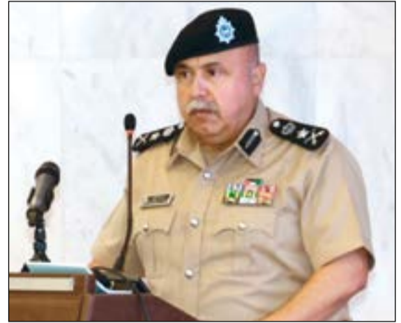
الفريق سليمان الفهد متحدثاً لقيادات «الداخلية»

المهام اديت بشكل متسرع او لعدم الدراية بالإبعاد او بعدم فهم القضية او الموقف بشكل صحيح او الإفراط بالثقة وهذه عوامل وأسباب نلتمسها وعلينا مسؤولية مناقشتها والعمل على تلافياها في المستقبل. وأكد الفريق الفهد ان الأخطاء ترشدنا على كيفية تصحيح المسار وكيفية تقويم المسار وتصحيحه. وأوضح ان واجبات الداخلية وأعمالها كبيرة ومتعددة وإنجازات وزارة الداخلية لا تعد ولا تحصى وهي أوسمة فخر على صدورنا جميعاً نعزّز بها ونفخر بها.