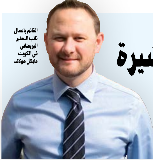
القائم بأعمال نائب السفير البريطاني في الكويت مايكل هولاند