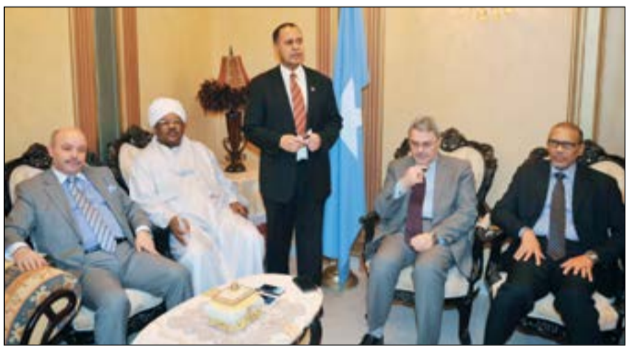
السفير الصومالي عبدالقادر أمين شيخ ملقياً كلمته