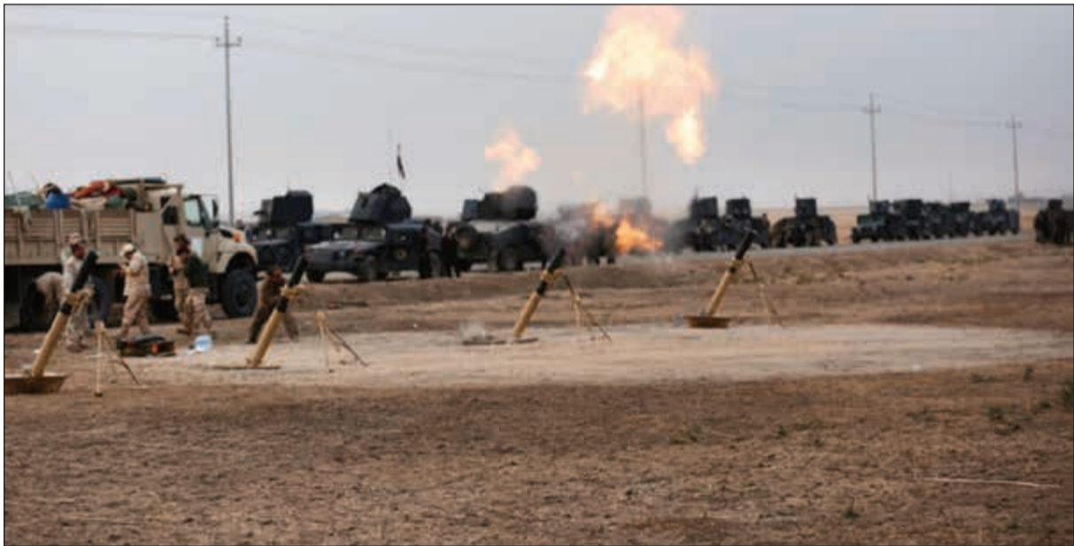
كليات قوات النخبة العراقية تطلق نيرانها باتجاه مواقع تنظيم داعش في الموصل امس

بشكل مفاجئ إلى إقليم كردستان العراق، أمس الأول، لتقديم الاستشارات للقوات العراقية والبيشمركة الكردية خلال معركة الموصل. يأتي هذا بينما أكدت مصادر صحافية أن سليمان حضر لقيادة قوات النخبة التابعة لـ«فيلق القدس» التي دخلت إقليم كردستان العراق للمشاركة في معركة الموصل، إضافة إلى إشرافه على قوات الحشد الشعبي في هذه المعركة. ميدانيا، أعلنت وزارة الدفاع العراقية عن تمكنها من تحرير قضاء الحمدانية جنوب شرقي الموصل من قبضة تنظيم (داعش) في حين تمكنت قوات البيشمركة من صد هجوم شنه مسلحو التنظيم على قضاء سنجان غرب الموصل. وقالت وزارة الدفاع في بيان: ان القوات العراقية قتلت خلال عملية تحرير الحمدانية أكثر من 100 مسلح ومدعت العشرات من السيارات المفخخة وتمكنت من رفع وتفكيك المئات من العوبات الناسفة، كما قامت بتمشيط القضاء من الخاليا الارهابية المتبقية. كما تمكنت قوات مكافحة الإرهاب العراقية من السيطرة على ثلاث قرى شرق مدينة الموصل واقتراعها من قبضة تنظيم (داعش)، هي: الخزنة