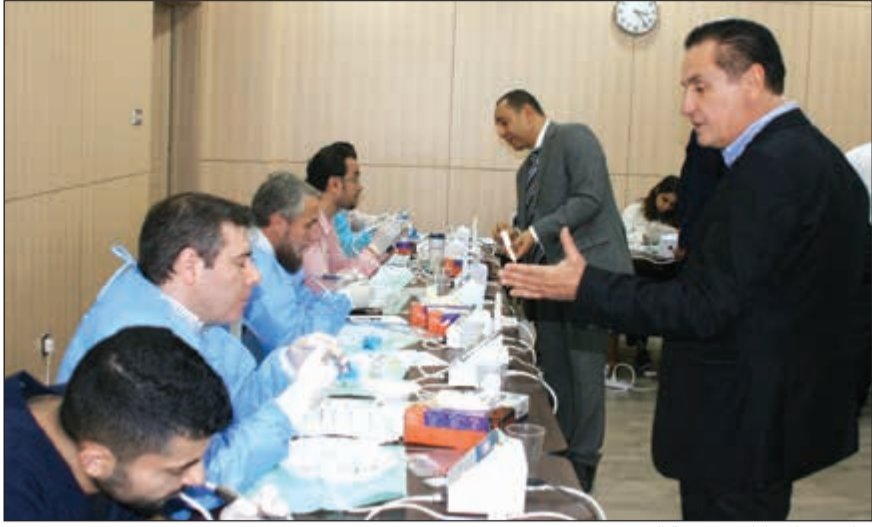
نقاش مع المشاركين بورشة العمل