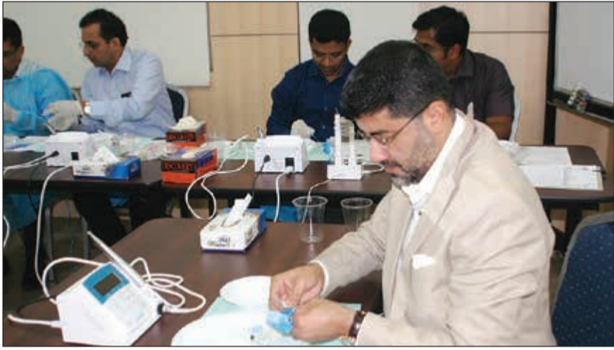
جانب من ورشة العمل

تحت إشراف إدارة طب الأسنان «مكتب التعليم المستمر لطب الأسنان» بوزارة الصحة أقامت شركة الساير الطبية إحدى شركات مجموعة الساير القابضة والوكيل الحصري في الكويت لشركة SybronEndo العالمية الرائدة للأسنان، محاضرة علمية وورش عمل عن أحدث التقنيات في علاج عصب الأسنان.