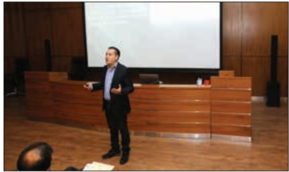
من المحاضرة العلمية

مطلقة على أرض الملعب وخارجه. قميص «كولماكس بولو» COOLMAX® Polo نظام إدارة الرطوبة الذي تم تزويد قمصان «كولماكس بولو» COOLMAX® Polo به، على تكنولوجيا متطورة لامتصاص العرق من دون التأثير في راحة الملابس ولمسها الناعم. سراويل «إكس دراى تايريد»: تتصف سراويل «إكس دراى تايريد» XDRY® Tapered بكونها مقاومة للماء وخفيفة الوزن، كما يبقى الرباط عند الخصر قمصان بولو مزودة بنبات داخل السروال.