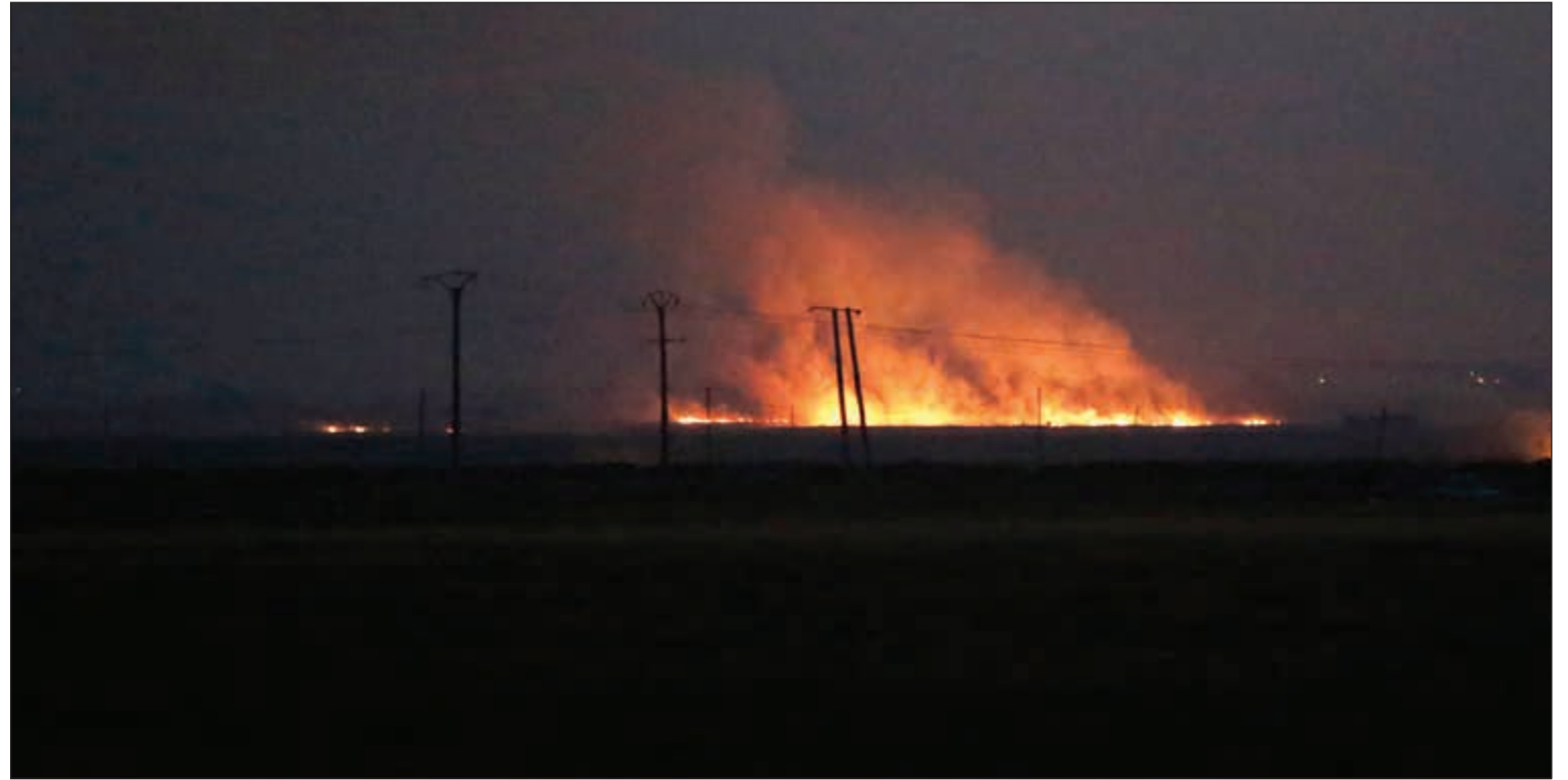
الدخان والسنة النار تتصاعد من موقع لقوات سورية الديمقراطية ذات الغالبية الكردية «قسد» بعد غارة تركية في تل رفعت (رويتزر)

وأضاف المرصد أن الغارات خلفت 6295 قتيلًا من المدنيين والمقاتلين. وأشار إلى أن من بين المجموع العام للضحايا البشرية يوجد 642 مدنيًا سوريًا.