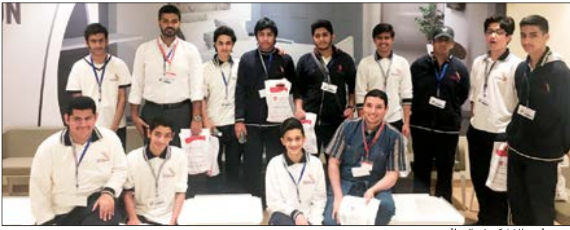
مجموعة من المشاركين في الحملة