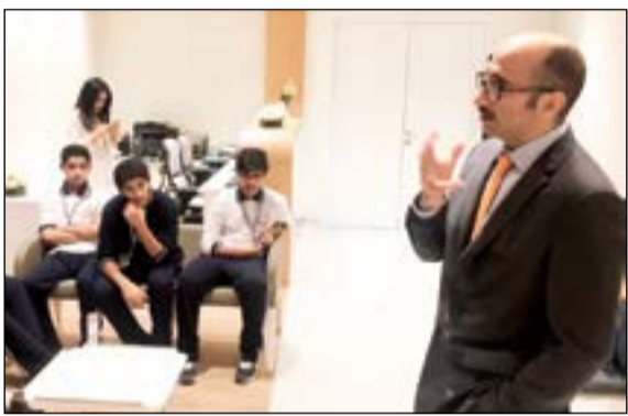
جانب من الحملة التوعوية