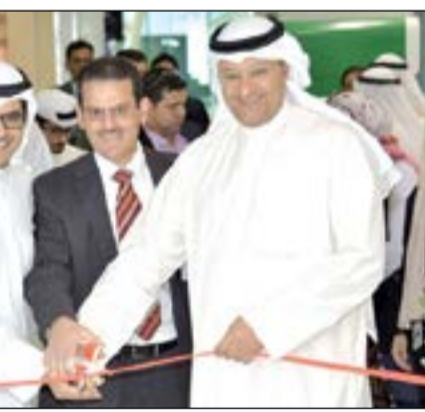
د.علي العبيدي ومازن الناهض يفتتحان مركزي القلب والعظام الجديدين

قال وزير الصحة د.علي العبيدي ان الخطوات التوسعية التي يقوم بها مستشفى السلام الملوك لبيت التمويل الكويتي «بيتك» تواكب التطورات العالمية في المستشفيات الكبرى بما يساهم في الارتقاء بالخدمات الطبية التي تقدم للمواطن والمقيم. وأشاد العبيدي خلال افتتاحه مركزين جديدين في إطار توسعة مستشفى السلام الدولي أحد أهم أمراض القلب والأخر لجراحة العظام بحضور ومشاركة الرئيس التنفيذي في مجموعة «بيتك» مازن الناهض، بالجهود المبذولة لتطوير المستشفى مؤكدا حرص الحكومة على النهوض بالخدمات الطبية في القطاعين العام والخاص لخدمة المواطنين والمقيمين والارتقاء بمستوى الخدمة من خلال اضافات فنية متخصصة ونوعية ذات اثر ايجابي ملموس على الاداء ومستوى جودة الخدمة المقدمة. من جانبه، قال الناهض ان استثمارات «بيتك» في مجال