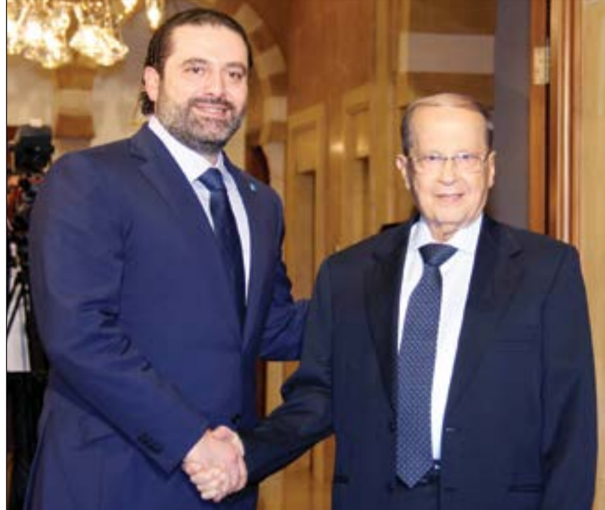
الرئيس سعد الحريري مستقبلاً العماد ميشال عون في بيت الوسط

رئيس الحكومة السابق نجيب ميقاتي نفى ما نشرته إحدى الصحف القريبة من 8 آذار عن أنه زار الرابية سرا