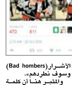
الإشعار (Bad hombers) وسوف نطردهم». والمثير هنا أن كلمة

عواصم - وكالات: كعادته بعد كل مناظرة، أشعل المرشح الجمهوري دونالد ترامب مواقع التواصل الاجتماعي بالتعليق الساخر أحيانا والبلط والبلط أحيانا أخرى عن معاني المصطلحات الجديدة التي استخدمها وعلى رأسها عبارة «Badhombers» و«bigly». إذ وعند سؤاله عن سياسته إزاء الهجرة، أعاد ترامب التأكيد على موقفه الداعي إلى بناء جدار على الحدود المكسيكية، إضافة إلى تعهده بإبعاد المهاجرين غير الشرعيين. غير أن الجديد في هذه المناظرة التي جرت فجر أمس هو العبارة التي استخدمها ترامب لوصف المهاجرين غير الشرعيين، وقال «لدينا بعض الرجال