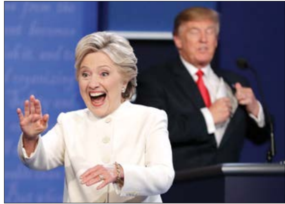
الغريمان هيلاري كلينتون و دونالد ترامب بعد انتهاء المناظرة

وأضاف هذا الخبير بحسب، لجمهوريين. وقد برر هذا الرفض بوجود عمليات تزوير انتخابية كبيرة يعترض عليها مؤيدوه. وردت كلينتون على الفور قائلة ان تصريح منافسها «مروع». وأضافت «انه يحط من قدر ديموقراطيتنا ويشوهها. يفزعني ان يتخذ مرشح أحد حزبينا الرئيسيين مثل هذا الموقف». وأضافت «ما ان يرى دونالد ترامب ان الامور لا تسير لمصلحته، يؤكد ان كل شيء مزور ضده».