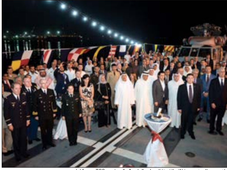
جانب من الحضور خلال الاحتفال على البارجة «كورفيت TCG بويوكادا»