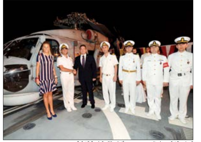
السفير التركي مراد تأمير مع عدد من أفراد طاقم البارجة التركية