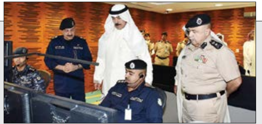
الشيخ محمد الخالد خلال تفقده الموقع الاحتياطي للحاسوب الرئيسي وبيجانبه الفريق سليمان الفهد واللواء جمال الصايغ

الخالدي: ربط غرف عمليات الدول الخليجية قريباً ونمتلك التقنيات لأداء واجبنا ولا مكان للمسيء أو المقصر بيننا