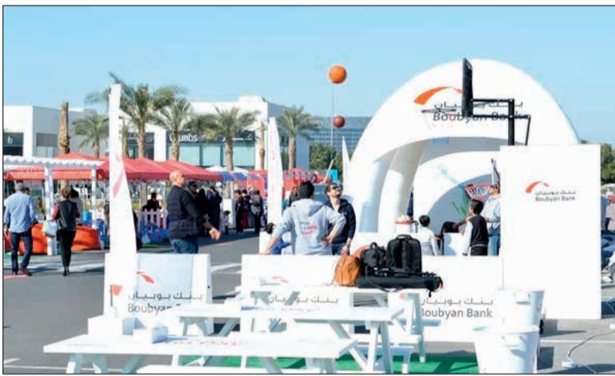
مشاركات من العام الماضي

يشارك بنك بوبيان في معرض LIFE 4 FIT الذي يقام يومي الجمعة والسبت المقبلين في منطقة المطاعم الجديدة (روج) وذلك في إطار دعم البنك للمشاريع الكوبية الشبابية وحرصه للمشاركة في الفعاليات التي تستقطب شريحة الشباب والعائلات.