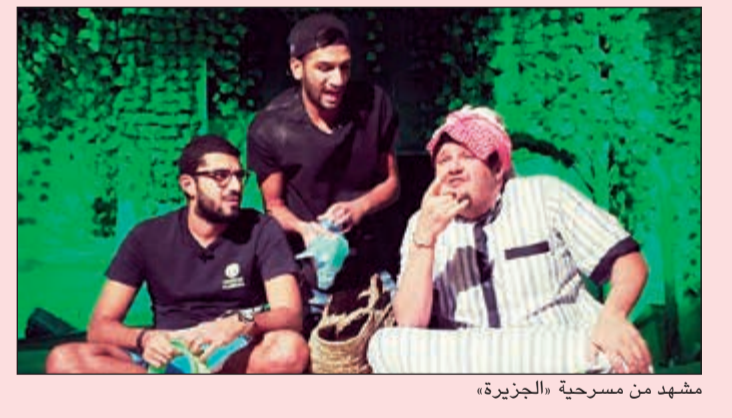
مشهد من مسرحية «الجزيرة»

في طرح مختلف لعروض «لايف شو» التي يتزامن تقديمها للمجمهور مع نقلة سياسية مهمة في الكويت، قدم المخرج محمد الحملي العرض الأول لمسرحية «الجزيرة» بنكهة كوميدية سياسية، تحمل الكثير من الآمال في قلوب مواطني الكويت، بأن يكون النواب القادمين أفضل وأقرب في خدمتهم وبعيدا عن خذلانهم. تروي «الجزيرة» مواقف مواطن وعد أهل منطقتهم بتفنيد طلباتهم، وبعد ان اصبح مسؤولا تغير وغير أرقامه ومنطقته وهاتفه واصبح أنانيا، ولم يكف بذلك بل يفرض عليهم أموالا ليقوم بمصالحهم