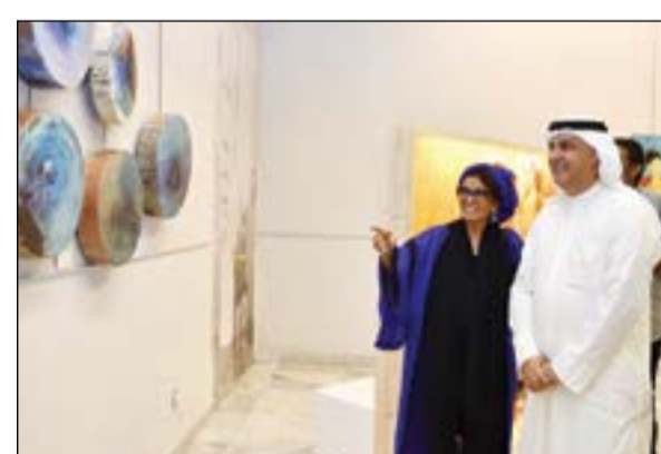
.. ومتابعة لعدد من لوحات الفنانة فاطمة لوتاه