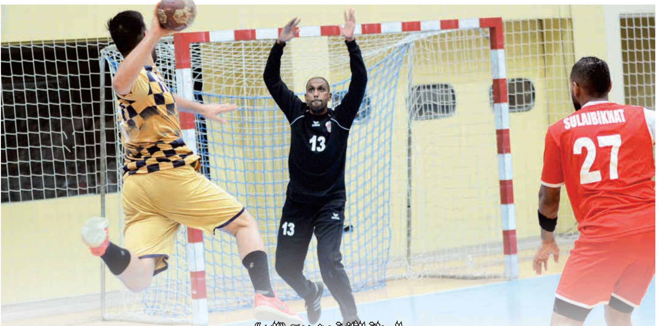
الجملة الثانية من صبح «اليد»

إسكان جلوبال للمعارض ESKAN GLOBAL EXHIBITION