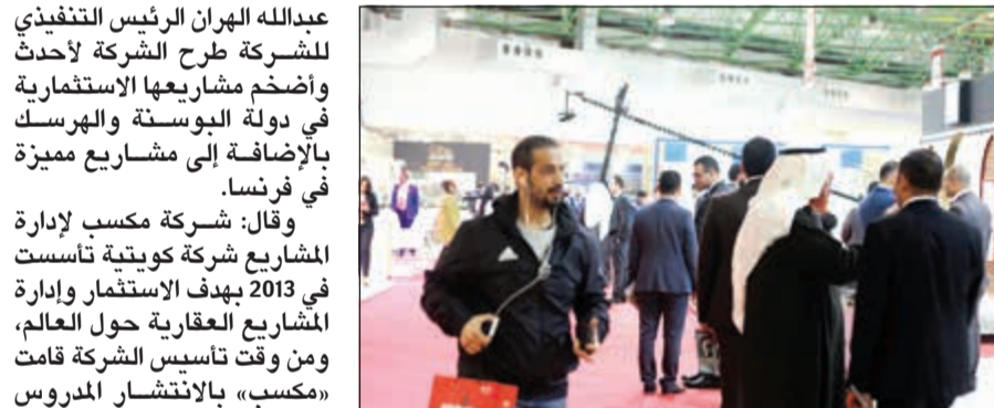
إقبال جماهيري كبير على معارض النخبة