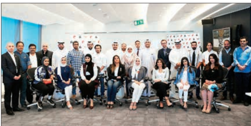
حكام اللجان من مجموعة شركة مشاريع الكويت وممثلي تمكين

أعلنت شركة مشاريع الكويت القابضة (كيبكو) عن تأهل 5 مبادرين شباب يديرون شركات ناشئة في مجال التجزئة والخدمات إلى المرحلة النهائية من جائزة كيبكو تمكين لدعم مشاريع الشباب في دورتها الثانية، والجائزة هي ثمرة التعاون بين شركة المشاريع ومؤتمر تمكين الشباب.