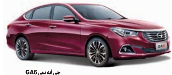
جي آيه سي GA6