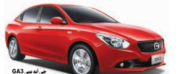
جي آيه سي GA3

تعرض شركة المطوع والقاضي سيارة (جي اس 5) المتطورة والتي تقدمها للراغبين باقتنائها بسعر من 5999 ديناراً إلى 4555 ديناراً، مع كفاءة 11 سنة، وتقديم أعلى تأمين لسيارتك، وصيانة 3 سنوات أو 30 ألف كيلومتر (زيت وفلتر المحرك)، وكذلك التسجيل في المرور مع التأمين لمدة 3 سنوات، مع 1000 لتر بنزين هدية من الشركة.