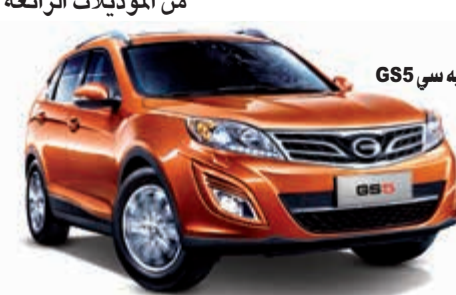
جي آيه سي GS5

وتعتبر سيارة جي آيه 3 متفانية بإداء محركها العالي ذي الاسطوانات الأربعة 1.6 لتر وبسعة 1600 سي سي، والصمام المزوج بتوقيت إلكتروني متغير، وهي ذات كفاءة اقتصادية من حيث استهلاك الوقود، وتمتيز بهيكلها المتطور بالإنترنت مع شركة بوش، وهي بعة ألوان (الأسود، الأبيض، الفضي، الأزرق، العنابي)، واللون