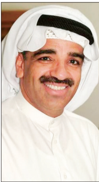
النجم صلاح الملا