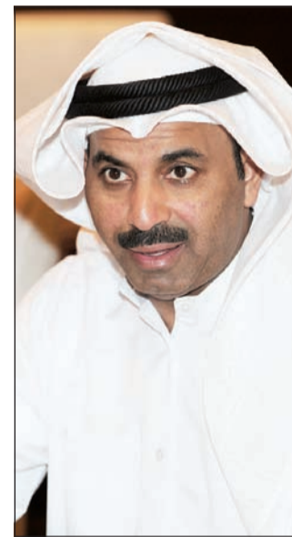
نقيب الفنانين الكويتيين طارق العلي

المجلس، مما يخلق حواراً واحترافاً يرسخ القيم الفنية الكبرى. جدير بالذكر ان لجنة تحكيم الأفلام الروائية للمهرجان تضم كلا من خالد البدر من الإمارات، ووليد العوضي من الكويت، وفخرية خميس من عمان، أما لجنة تحكيم الأفلام التسجيلية والتحرير فتضم فريد رمضان من البحرين، وشهد أمين من السعودية، وخليفة المريخي من قطر. وسيقوم المهرجان بتكريم عدد من رواد الفن السابع في منطقة الخليج وهم المخرج أحمد الخلف من الكويت والمخرج علي مصطفى من الإمارات والمخرج أيضاً داود من البحرين والفنان صالح زعل من سلطنة عمان والفنان أحمد الملا من المملكة خليفة المريخي من قطر.