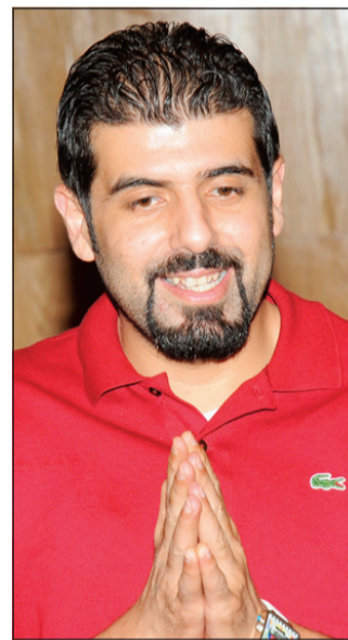
المخرج السينمائي أحمد الخلف