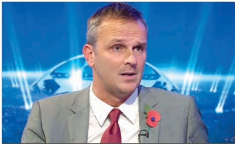
نجم ليفربول السابق هامان

سرى ديتمار هامان نجم فريق ليفربول السابق، أن الريدز الأوفر حظا في منافسة مان سيتي على لقب الدوري الإنجليزي هذا الموسم.