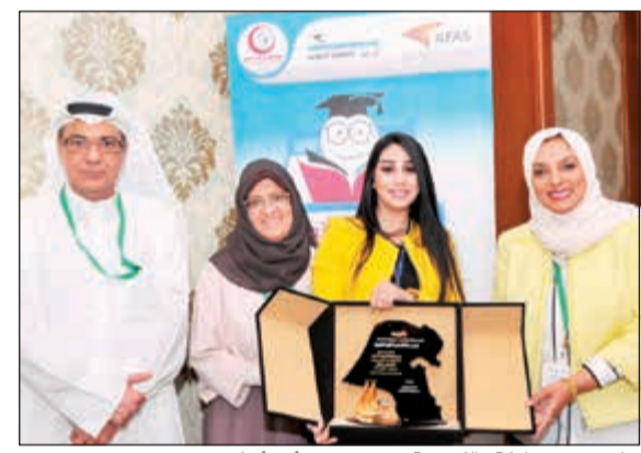
جانبا من مشاركة «الكويتية» في مؤتمر «أبي أتعلم»

الكويتية على تقديم الرعاية لمؤتمر «أبي أتعلم» الذي أقامته جمعية صندوق اعادة المرضى، في 30 سبتمبر الماضي في فندق ريجنسي - الكويت. وجاءت مشاركة «الكويتية» في الحدث انطلاقا من المسؤولية الاجتماعية التي لطالما التزمت بها وعملت من خلالها على ترسيخ حضورها في المجتمع عبر تقديم الدعم والرعاية لأية مبادرة تهدف إلى بناء مستقبل أفضل للكويتي. ويمثل الهدف من مؤتمر «أبي أتعلم» في تعليم الأطفال المرضى والمصابين بالأمراض المستعصية والمزمنة التي تتطلب منهم البقاء في المستشفيات لفترات طويلة تستدعي الانقطاع عن الدراسة والحياة اليومية. وقد حضر المؤتمر ممثل عن رئيس مجلس الأمة مرزوق الغانم وممثل عن الشيخة أورد جابر الاحمد، بالإضافة إلى نخبة من الأطباء والأساتذة من داخل البلاد وخارجها. وتأتي اسهامات