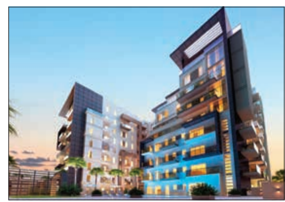
داماك ميوزون دو فيل تينورا أول مشروع على الإطلاق يتم إنجازه في دبي

أعلنت شركة داماك العقارية اليوم عن أول مشروع على الإطلاق يتم إنجازه في دبي الجنوب، إذ بدأت الشركة في تسليم الشقق الفندقية في «داماك ميوزون دو فيل تينورا». وأعلن المطور العقاري الرائد أيضا أن «داماك ميوزون دو فيل سيلستيا»، مشروع الضيافة الآخر في المنطقة ذاتها بلغ مرحلة متقدمة من الإنشاء، ويتيح كالمشروعين للمستثمرين الفرصة الأولى لتسليم العقارات في دبي الجنوب وبدء تحقيق العوائد على الفور. ويحتل «داماك ميوزون دو فيل تينورا» و«داماك ميوزون دو فيل سيلستيا» موقعا استراتيجيا في قلب دبي الجنوب، المنطقة