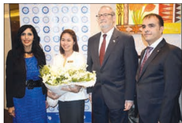
السفير الأميركي لاري سيلفرمان وداني صالح وجوليبيت ديكا

شديد الحرص على تقديم أفضل الخدمات وأكثرها رقياً إلى ضيوفنا. هذا، وقد رافق الضيف كبار المسؤولين في السفارة إلى الاجتماع الذي حضره كوكبة من رجال الأعمال وكبرى الشركات الأمريكية، حيث تداول المجتمعون أهم فرص تنشيط حركة الأعمال في الكويت. وقد عبر الضيوف عن شدة إعجابهم وتقديرهم لحفاوة الاستقبال وكرم الضيافة والخدمات المميزة، لاسيما والأجواء الرائعة التي غمرت اجتماعهم.