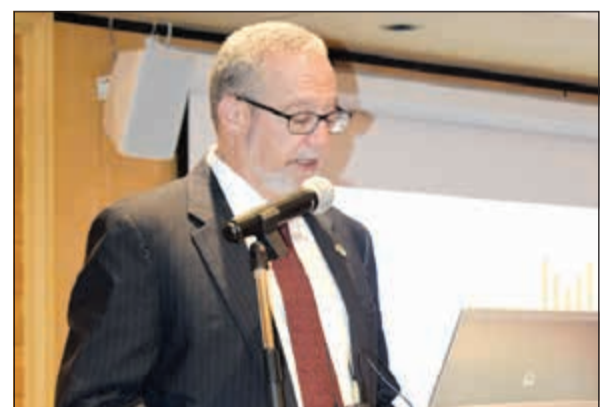
السفير الأميركي لاري سيلفرمان

الصف. وأضاف صالح: إنه لشرف كبير لنا أن نستقبل السفير الأميركي في ربوع ميلينيوم، لافتنا إلى أن مجموعة فنادق ميلينيوم وعددها 120 فندقاً موزعة حول العالم تحتل مكانة ريادية مرموقة، ونحن على دراية تامة بالدور الذي نسهم به، كأحد معالم الكويت الحضارية، ليس على الصعيد استقطاب كبار الشخصيات إلى البلاد فحسب، بل كعنصر فعال في جذب رجال الأعمال من جميع أنحاء العالم. واختتم بالقول: «انطلاقاً من هذا المفهوم، نحن نحرص