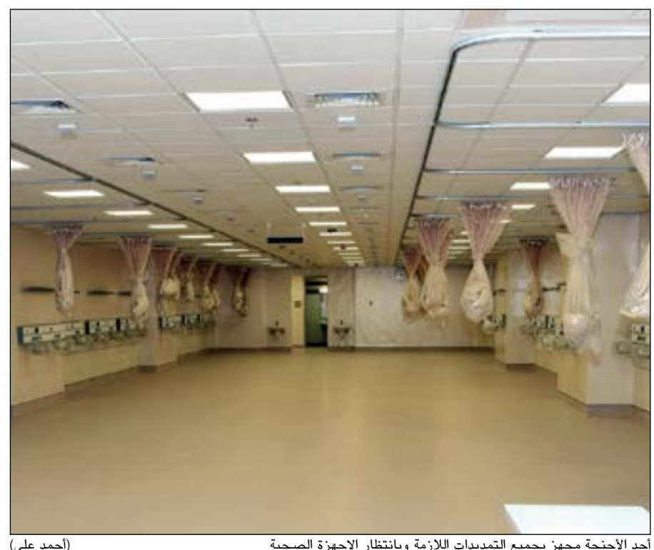
أحد الأجنحة مجهز بجميع التجهيزات اللازمة وبانتظار الأجهزة الصحية (أحمد علي)