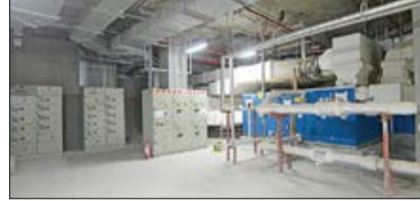
جوانب مختلفة من مرافق المستشفى وقد زودت بالمعدات والتجهيزات اللازمة سواء الكهرباء أو التكيف أو وصلات الأجهزة الطبية

أدى إلى تداخل الأوضاع والتخوف خلال تلك الفترة ما أثر على توفير العمالة للمشروع، ولكن بعد ذلك تم التغلب عليها وعادت الأمور إلى ما كانت عليه.