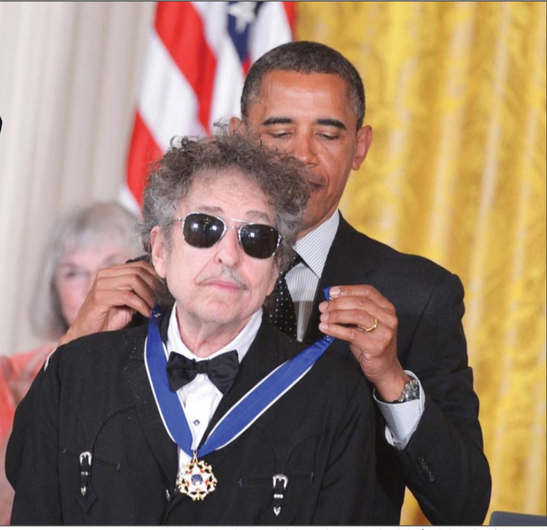
الرئيس الأميركي باراك أوباما يقبل بوب ديLAN وساماً تقديرياً

أ.ف.ب: فاز المغني الاسطوري الأميركي بوب ديLAN الخميس بجائزة نوبل للآداب التي تمنح للمرة الأولى الي مؤلف أغان ما اثار دهول الحضور.