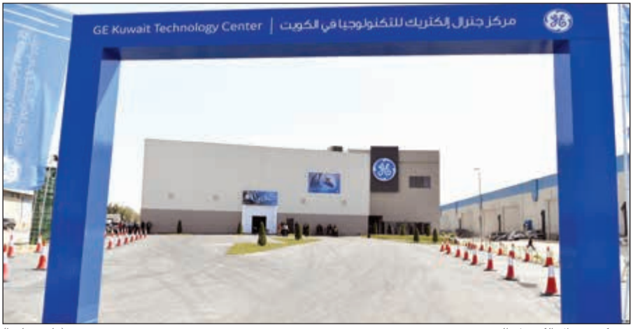
مركز جنرال إلكتروك للتكنولوجيا في الكويت | GE Kuwait Technology Center (قاسم باشا)