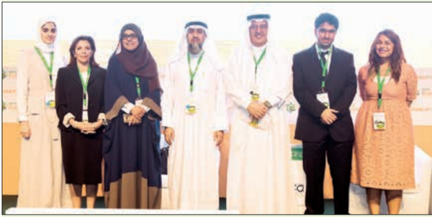
لقطة تذكارية لموظفي الشركة

وتمت رعاية حضور عضو الهيئة التدريسية والطبية في هذا المؤتمر وغيره من فعاليات جيبكا السابفة بناء على مذكرة التفاهم التي تم توقيعها خلال العام 2008 فيما بين شركة إيكويت والكلية لغرض الشراكة والتعاون في المجالات الصناعية والأكاديمية. يقام مؤتمر جيبكا الثالث للاستدامة 2016 في دبي بدولة الإمارات العربية المتحدة، بمشاركة العديد من المؤسسات الحكومية والخاصة من مختلف أرجاء العالم.