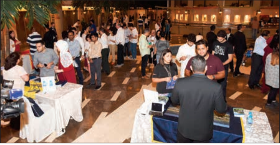
إقبال كبير من الجمهور على فعاليات المعرض