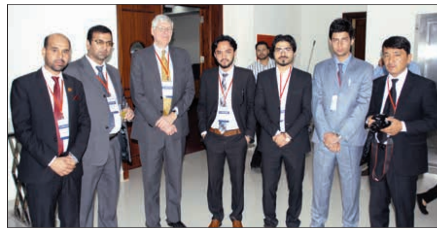
عدد من المدربين