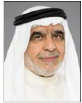
عدنان عبد الصمد

إن التضحية العظيمة التي قدمها الإمام الحسين ﷺ هو وأهل بيته وثلة من أصحابه في يوم عاشوراء الخالد تمثل الشعلة التي أنقذت البشرية جمعاء من الوقوع في مهاوي الظلم والاستبداد والطغيان، فكانت صرخته المدوية وشعاره الحاسم «هيئات منا الذلّة» نبراسا يقنّدي به الأحرار والقوار على مر العصور ليزلزلوا الأرض تحت أقدام الظالمين، وتهاوى عروش المتجبرين