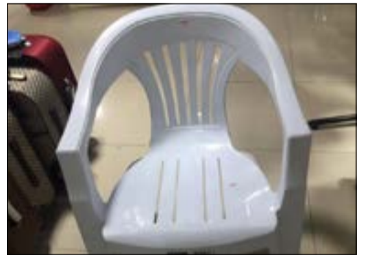
الكرسي الذي آثار حفيظة أحد المتسوقين

أعرب أحد المواطنين عن استغرابه الشديد لرؤية الكراسي في إحدى الجمعيات التعاونية يتم بيعه بسعر 4,125 دنانير متسائلا عن الارتفاع الفاحش في سعره وانه مبالغ فيه للغاية، وفي الوقت ذاته كيف يمكن أن يتم تسعير هذا الكرسي في غياب الرقابة؟ وكم نسبة الربح التي تحصل عليها المَن وراء بيعه؟