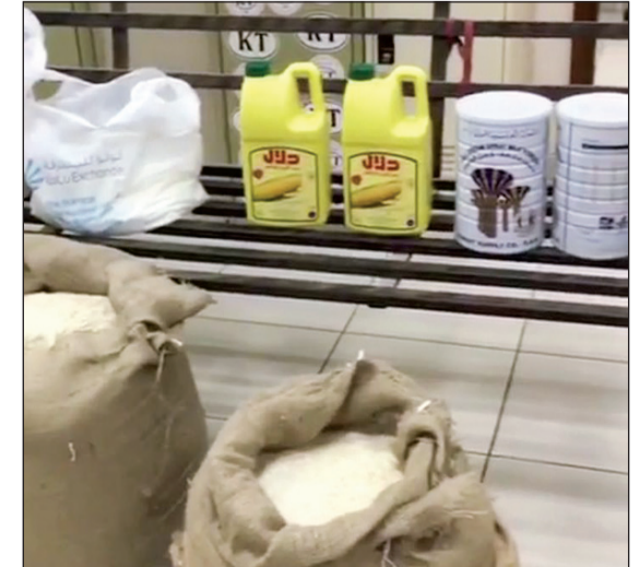
مواد تموينية متنوعة ضبطت قبل التهريب

صادر رجال ميناء الدوحة امس كمية ضخمة من المواد التموينية المدعومة كانت في طريقها الى جمهورية ايران. وقال مصدر جمركي ان رجال جمرك الدوحة اشتبهوا في كمية كبيرة من العبوات يفترض احتواؤها على مواد تدخل في غسيل الملابس، وافتح هذه العبوات تبين ان بداخلها كل انواع المواد الغذائية المدعومة (سكر وزيت وعيش ولبن ومعجون طماطم).