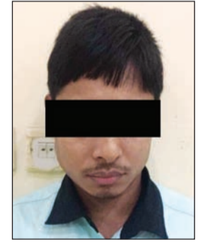
المتهم في قبضة المباحث

بتعليمات من وكيل الوزارة المساعد لشؤون الجنسية والجوازات اللواء الشيخ مازن الجراح وياشراف مدير عام الإدارة العامة لمباحث شؤون الإقامة العميد سعود الخضر، تم تشكيل فريق امني من رجال مباحث الإقامة، وبعد البحث والتحري حول هذه المعلومات واتخاذ الإذن القانوني اللازم تم