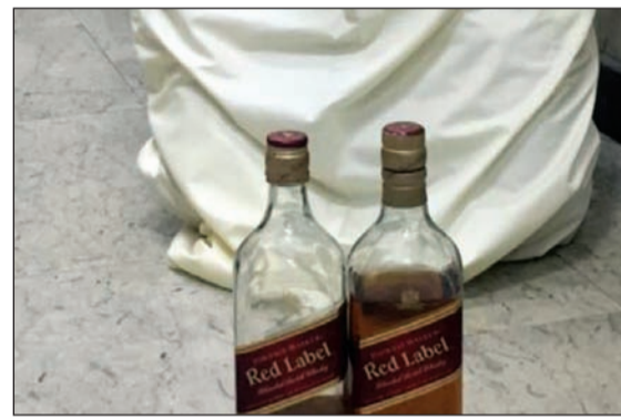
الخمور التي قفها السكران إلى رجال الأمن

لبيتم اخطار مدير عام مديرية امن الفروانية العميد صالح مطر والذي أمر بإحالته الى الادارة العامة لمكافحة المخدرات. من جهة اخرى، واصل رجال امن الفروانية تحرير مخالقات الأضواء الذين يتوقفون بمركباتهم في مواقف المعاقين، وقام