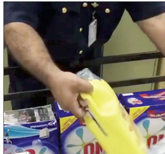
الزيوت أخفيت داخل علب غسيل الملابس