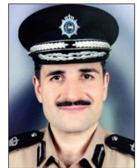
اللواء طلال معرفي

التراخيص من الكويتيين وأن تكون الصحيفة الجنائية لهم نظيفة إلى جانب ألا تقل أعمارهم عن 30 عاما وأن يقدموا خطابات وضمانات مالية تؤهلهم للحصول على الرخصة. وذكر اللواء معرفي انه يلزم طالب الحصول على رخصة لشركة مزاوله نشاط استخدام عمالة منزلية الآتي: 1 - أن يكون المدير المسؤول عن الشركة كويتي الجنسية. 2 - ألا يكون المدير المسؤول عن الشركة قد حكم عليه بعقوبة جنائية او في جريمة مخلة بالشرف او الأمانة ما