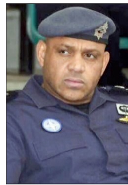
العميد صالح مطر

طلب رجال الأمن من قائد المركبة النزول للتوقيع على أقواله بالمخالفة، وإذ بالشخص ينزل مترنحا مخاطبا رجلي الأمن بقوله: «هلا بالحبيب»، وحينما سئل عما إذا كان سكران، أجاب: «ما في أحلى من السكر»، وأخرج زجاجتي خمر وقدمهما لرجال الأمن