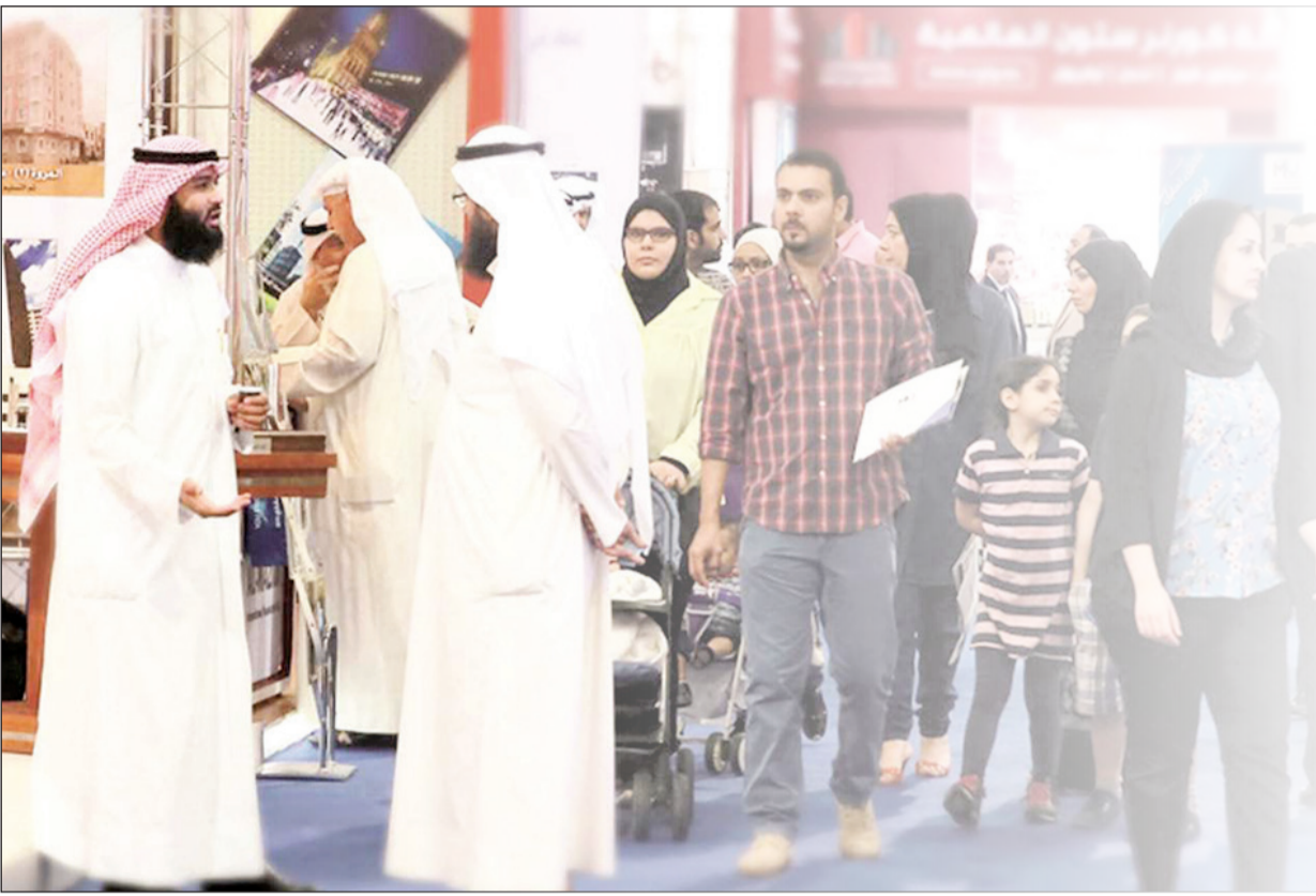
إقبال جماهيري كبير على معارض مجموعة إسكان جلوبل