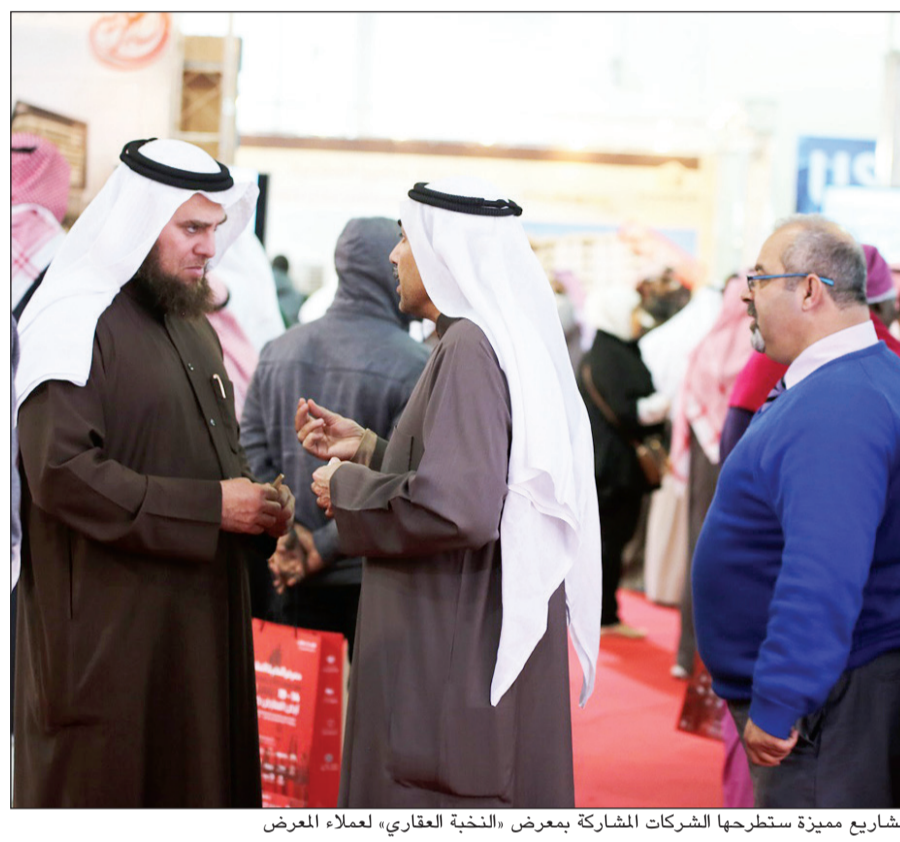
مشاريع مميزة ستطرحها الشركات المشاركة بمعرض «النخبة العقاري» لعملاء المعرض