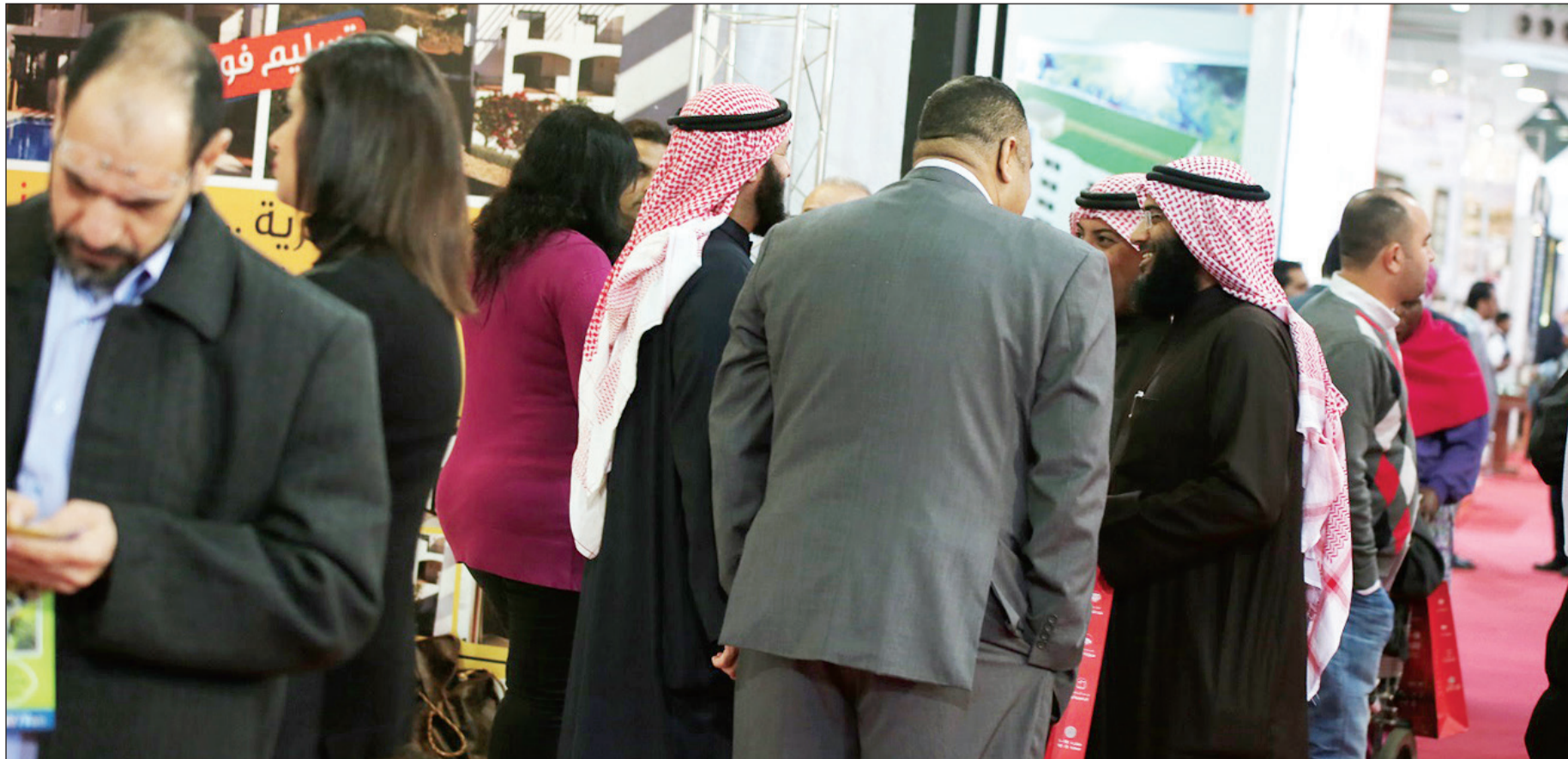
جانب من معارض النخبة العقارية السابقة