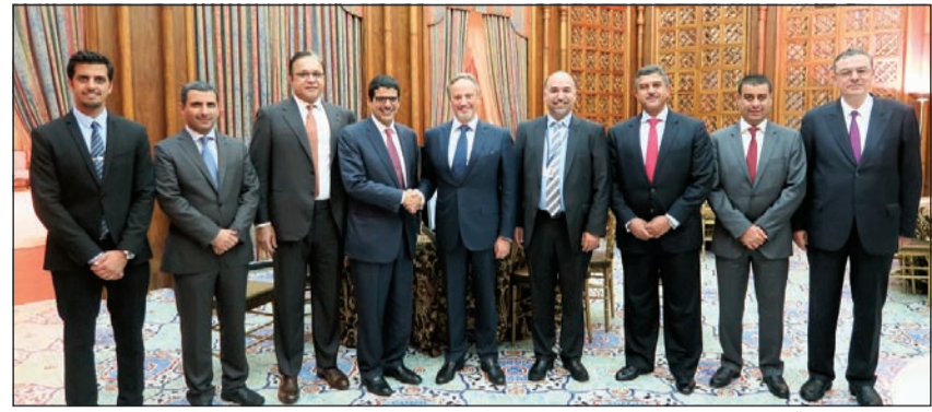
وفد «بيتك» مع السفير

حضر البنك على التواجد في كبرى المنتديات الاقتصادية التي تسهم في دعم اقتصادات الدول واستعراض الفرص الاستثمارية، وتبادل الخبرات والإطلاع على أبرز المستجدات على الساحة الاقتصادية، فيما يعتبر هذا الحدث الكبير والمهم منصة لإبراز دور صناعة الصيرفة الإسلامية وأهميتها في الاقتصاد كونها جزءاً أساسياً من منظومة الاقتصاد العالمي وتشهد نمواً وإقبالاً كبيرين. وأشار الناهض إلى أن «بيتك» شارك بعدة لقاءات ومؤتمرات على هامش