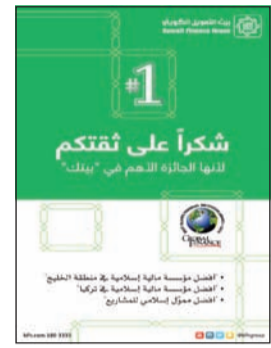
شكراً على ثقتمك للهمة الملهمة في «بيتك» البنك الدولي للصندوق البنك الدولي للصندوق

حضر البنك على التواجد في كبرى المنتديات الاقتصادية التي تسهم في دعم اقتصادات الدول واستعراض الفرص الاستثمارية، وتبادل الخبرات والإطلاع على أبرز المستجدات على الساحة الاقتصادية، فيما يعتبر هذا الحدث الكبير والمهم منصة لإبراز دور صناعة الصيرفة الإسلامية وأهميتها في الاقتصاد كونها جزءاً أساسياً من منظومة الاقتصاد العالمي وتشهد نمواً وإقبالاً كبيرين. وأشار الناهض إلى أن «بيتك» شارك بعدة لقاءات ومؤتمرات على هامش