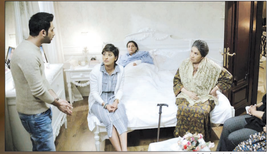
شجون في مسلسل «ساق البامبو»