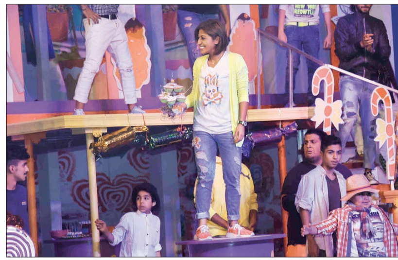
مشهد من مسرحية «بيت الحلاو»