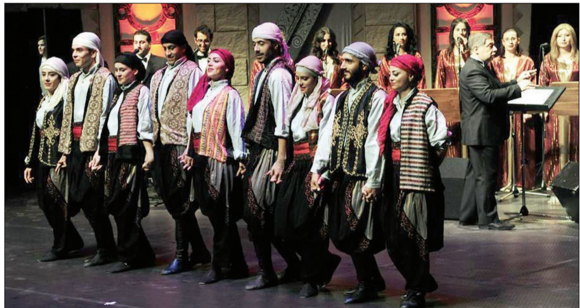
جانب من المشاركات في مهرجان قوس قزح سورية