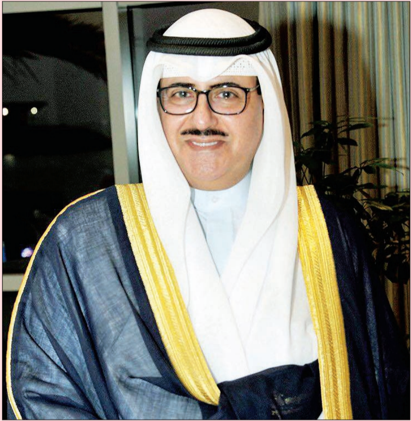
الشيخ فهد المبارك