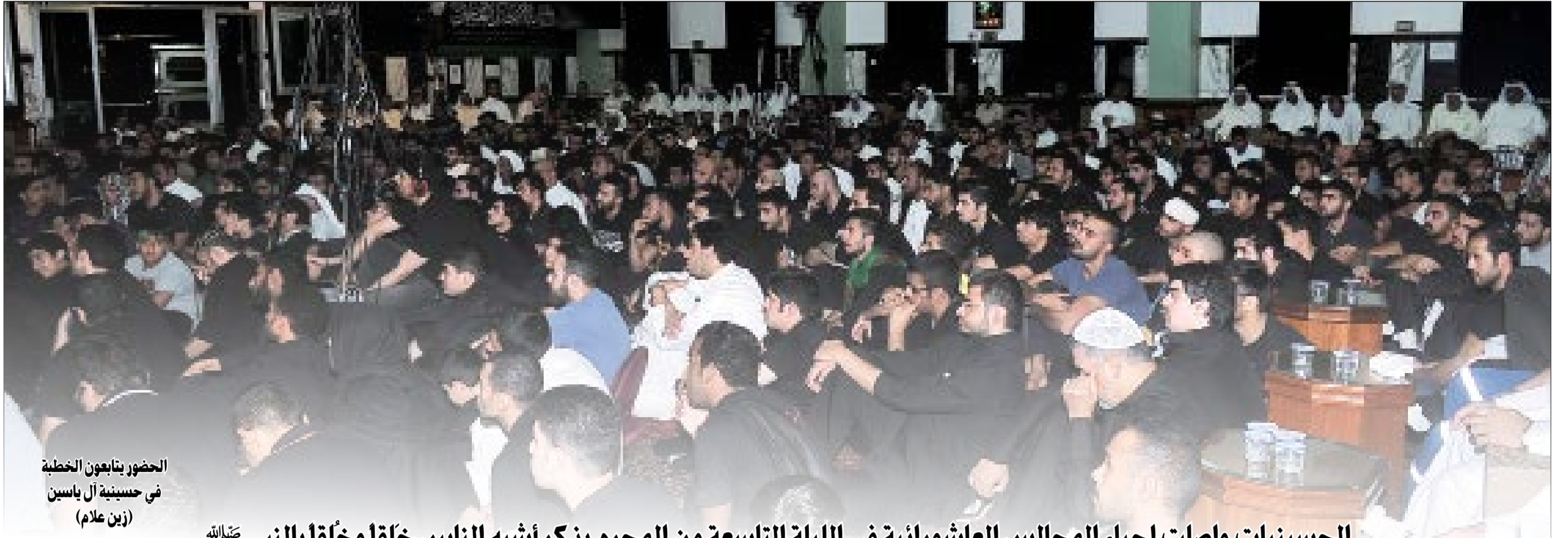
الحضور يتابعون الخطبة في حسينية آل ياسين (زين علام)

الحسينيات واصلت إحياء المجالس العاشورائية في الليلة التاسعة من المحرم بذكر أشبه الناس خلقاً وخلقاً بالنبي ﷺ