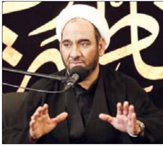
الشيخ عبدالأمير الخزازي