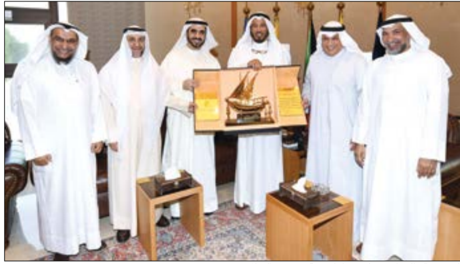
الشيخ خالد الجراح يتسلم درعا تكريمية من د.عبدالله المعنوق

استقبل نائب رئيس مجلس الوزراء ووزير الدفاع الشيخ خالد الجراح صباح امس رئيس الهيئة الخيرية الإسلامية العالمية والمستشار بالديوان الأميري ومبعوث الأمن للأمم المتحدة للشؤون الإنسانية د.عبدالله المعنوق، والوفد المرافق له.