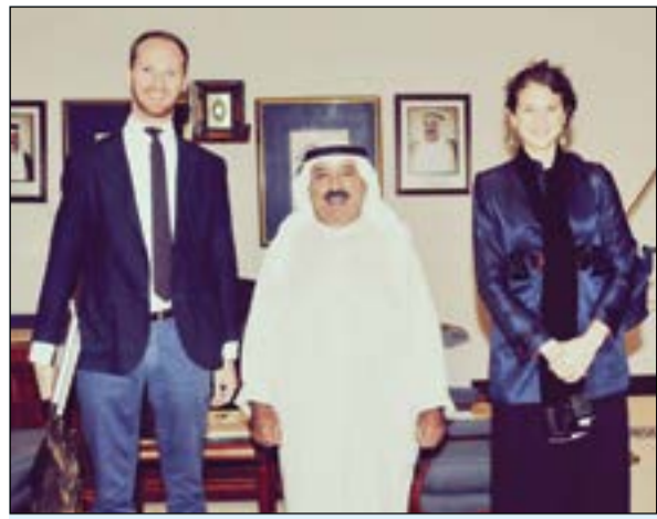
الشيخ ناصر صباح الأحمد خلال استقباله شوشانا ستيفورت وسكوت ليدل