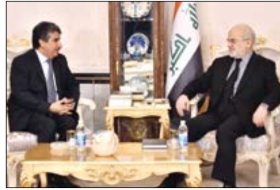
السفير سالم الزمانان خلال اجتماعه مع وزير الخارجية العراقي

بغداد - كونا: تسلّم وزير الخارجية العراقي ابراهيم الجعفري امس الاثنين دعوة رسمية من النائب الأول لرئيس مجلس الوزراء ووزير الخارجية الشيخ صباح الخالد لزيارة الكويت.