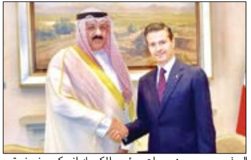
السفير سميح جوهر حيات ورئيس المكسيك إنريكي بيني نيتو

استعرض سفيرنا لدى الولايات المتحدة المكسيكية سميح جوهر حيات مع رئيس المكسيك إنريكي بيني نيتو مسار تاريخ العلاقات الثنائية «المتميزة» بين البلدين. وقالت سفارتنا لدى المكسيك في بيان ان السفير حيات نقل للرئيس المكسيكي تحيات صاحب السمو الامير الشيخ صباح الاحمد وتمنيات سموه له بمو فور الصحة والعافية ولشعب المكسيك المزيد من التقدم والازدهار. ويأتي اللقاء الذي حضرته وزيرة الخارجية كلاوديا روس ماريو ساليانس في قصر الحكم الجمهوري (لويس بينوس) وسط العاصمة مكسيكو سيتي بمناسبة انتهاء مهام عمل السفير حيات في المكسيك. وتمسنى الرئيس المكسيكي للسفير حيات التوفيق والنجاح. وكان رئيس الولايات المتحدة قد منح السفير حيات الوشاح الأعلى للجمهورية (نسر الاستيك) من الدرجة الأولى تقديراً لجهوده في تطوير العلاقات بين البلدين.