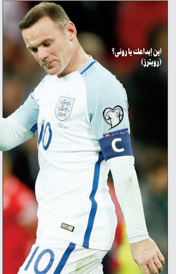
اين إيدامك ياروني؟ (روني)

انبرى غاريث ساوثغيت مدرب إنجلترا للدفاع عن قائد فريقه وين روني بعد أن أطلق مشجعون صيحات استهجان ضد هدف الأسود الثلاثة عبر العصور في الفوز على مالطا بتصفيات كأس العالم. وفي مباراته الأولى مع إنجلترا قال المدرب المؤقت إنه لا يفهم لماذا أطلق البعض ضمن حوالي 82 ألف مشجع صيحات استهجان ضد مهاجم مان يونايتد ووصفه بأنه لاعب تعرض للانتقادات «ظالمة». وأضاف المدرب في نهاية أسبوع قدم فيه قبعة كهديبة لروني بعدما أصبح أكثر لاعب في غير مركز حراسة المرمى خاض مباريات مع المنتخب الإنجليزي «لا أفهم ذلك لكنه يبدو أمرا معتادا. ليس لدي أي فكرة عن كيف سيساعده ذلك». واختار ساوثغيت أن يشرك روني الذي لعب 117 مباراة مع إنجلترا في خط الوسط لكن القائد قدم أداء آخر غير مقنع خاصة بعد بدايته المتواضعة مع يونايتد هذا الموسم. وانطلقت صيحات الاستهجان قرب النهاية عندما أرسل روني تمريرة عرضية بلا هدف لكن المدرب تحرك سريعا ليؤكد أهمية اللاعب