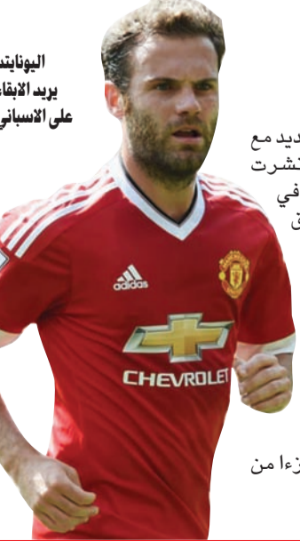
اليونانيد يبريد الأبقاء على الإسباني

قالت تقارير صحافية فرنسية إن اللاعب الأوروغوياني كاثاني يرفض التجديد لفريقه باريس سان جرمان. وذكرت صحيفة ليكيب، أن النادي الباريسي يمر بنازمة مع كاثاني، الذي رفض مؤخرا التجديد مع فريقه لـ 3 مواسم جديدة. ويعتبر كاثاني، من أكثر اللاعبين المطلوبين في السوق الأوروبية في السنوات الأخيرة، خاصة نادي أتلتيكو