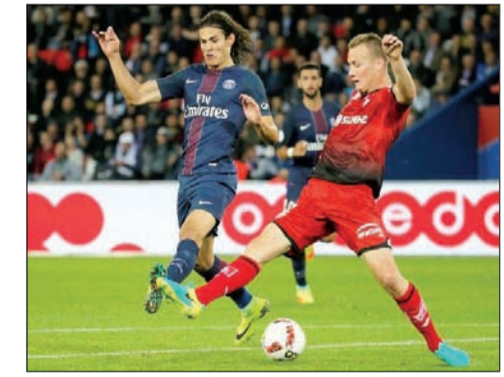
القناص لا يبريد التجديد مع بطل فرنسا

واصل توماس مولر لاعب بايرن ميونيخ والمنتخب الألماني، رقمه القياسي مع منتخب بلاده، بعدم الهزيمة في أي لقاء يسجل فيه. وشارك مولر في فوز الماكينات الألمانية على التشيك 3-0 ضمن منافسات الجولة الثانية من التصفيات المؤهلة لمونديال 2018. وسجل مولر هدفين في الدقيقتين 13 و56 بينما سجل توني كروس لاعب ريال مدريد هدفا في الدقيقة 49. ويعد الفوز على التشيك هو اللقاء رقم 25 لمولر الذي يسجل فيه ولا يخسر المنتخب، ليواصل رقمه القياسي، وفقا لموقع «squawka». كما أن البافاري مولر سجل هدفا الثامن في تاريخه بتصفيات كأس العالم ووصل في المجمل للهدف رقم 36 مع الماكينات المانشافت. ويستعد منتخب ألمانيا متصدرا المجموعة برصيد 6 نقاط، لمواجهة ايرلندا الشمالية غدا الثلاثاء ضمن منافسات الجولة الثالثة من التصفيات.