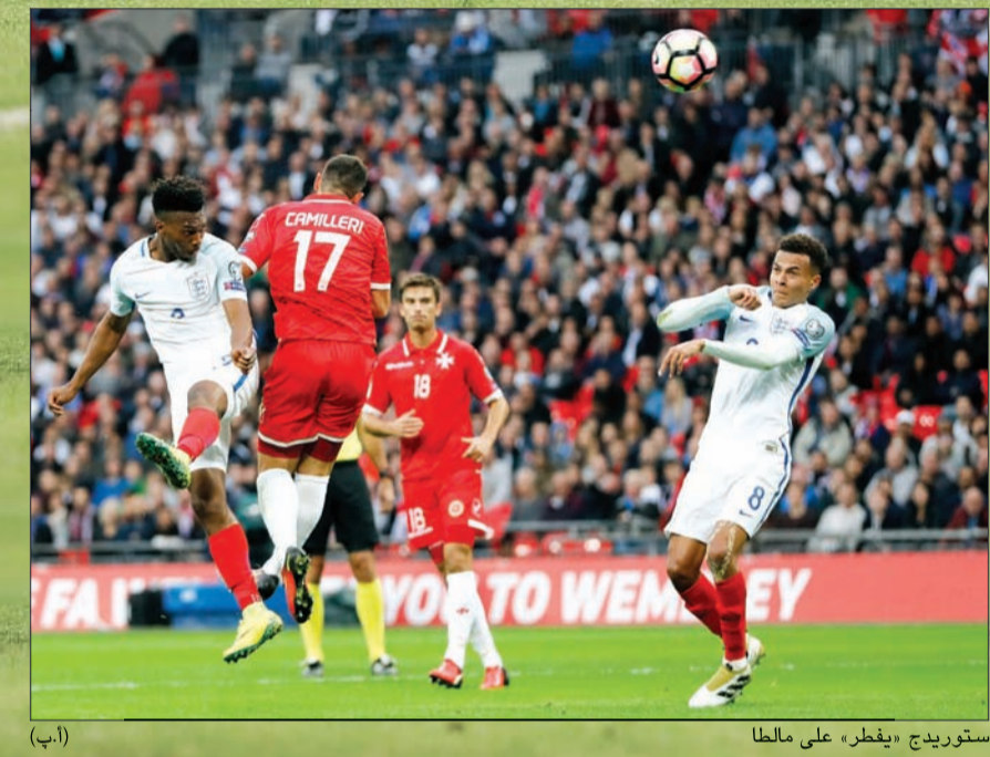
ستورديج «يفطر» على مالطا

فاز منتخب المانيا لكرة القدم على نظيره التشيكي 3-0 في الجولة الثانية من منافسات المجموعة الثالثة ضمن تصفيات أوروبا المؤهلة الى نهائيات مونديال 2018 في روسيا. وسجل توماس مولر (13 و65) وطنوني كروس (49) الاهداف. والفوز هو الثاني للماكينات بعد الاول على النرويج 3-0، في حين منيت تشيكا بخسارتها الاولى بعد تعادلها سلبا في الجولة الاولى مع ايرلندا الشمالية التي تغلبت على سان مارينو 4-0. على ملعب هامبورغ اريسا، افتتح ابطال العالم التسجيل من هجمة مرتدة عبر توماس مولر في الدقيقة 13. وفي الشوط الثاني، اضاف كروس الهدف الثاني (49). وحسم مولر النتيجة نهائيا بتسجيله الهدف الشخصي الثاني والثالث لمانيا بعد تمريرة من يوناش هكتور تابعها بيسراه في قلب المرمى (65). وعلى ملعب ويندسور بارك، تغلبت ايرلندا الشمالية على ضيفتها سان مارينو برباعية بياض افتحتها من ركلة جزاء ستيفن ديفيس (26). وفي الشوط الثاني، نقصت صفوف سان مارينو بطرد بالاتزوي لنيله الصفراء الثانية (49)، فسهلت